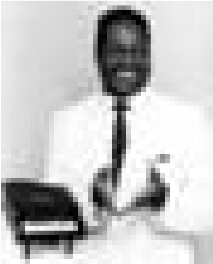
Fats Dominos Lieblingspianist: Little Willie Littlefield präsentiert Rhythm'n'Blues und Boogie Woogie auf seine unnachahmliche Art an diesem Samstag dem 14. Januar ab 21 Uhr im hauptstädtischen Sang a Klang.