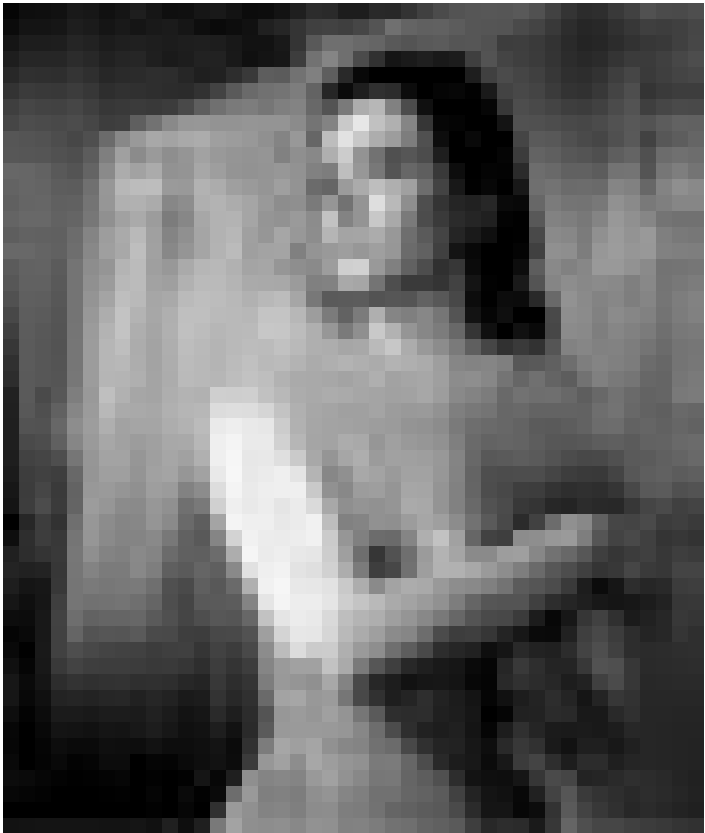
Maria, Maria ... Natalie Wood dans le rôle principal du musical "West Side Story" de Robert Wise. Dimanche à la Cinémathèque.

New York, 1959. Max Bialystock et Leo Bloom produisent "Springtime for Hitler", un musical tellement mauvais qu'il ne devrait pas survivre sa première.