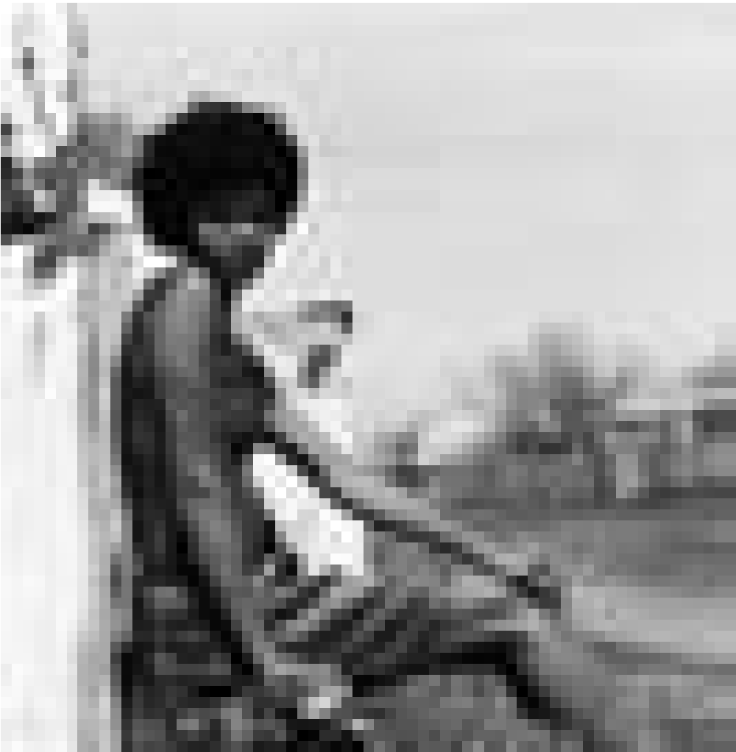
Ayo die Weltenbummlerin: Am 4. Juli ist die charismatische Sängerin in der Concert Hall des Casino 2000 zu Gast.

König Ödipus , Tragödie von Sophokles, Amphitheater (Olewiger Straße), Trier, 21h .