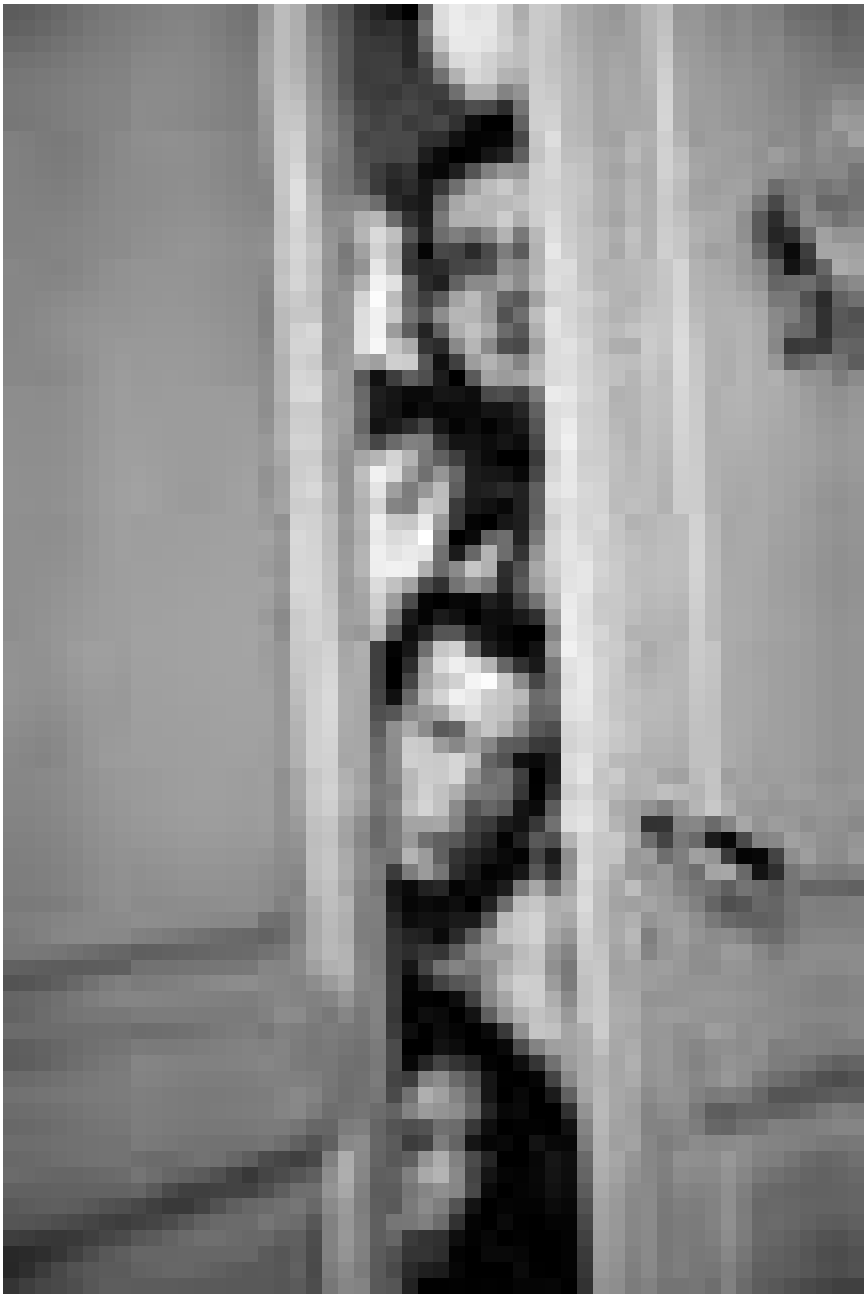
Amour et disputes à la clé. « L'auberge espagnole » de Cédric Klapisch. Dans le cadre du Mini-Festival « Europe behind the Facade », dimanche à la Cinémathèque.

D 1931 von Gerhard Lamprecht. Mit Fritz Rasp und Käthe Haack. 75'. O.-Ton. Nach Erich Kästner. Empfohlen ab 8 Jahren.