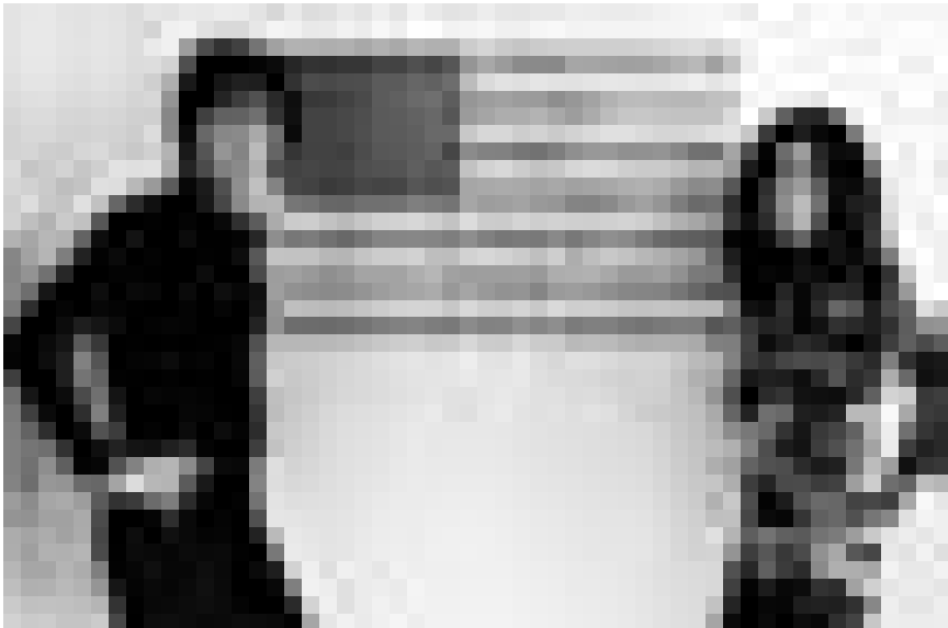
John Lennon et Yoko Ono ont vivement protesté contre la guerre au Vietnam. Documentaire « The U.S. vs. John Lennon », nouveau à l'Utopia.

Kosovokrise 1999: Eine amerikanische Truppe begleitet einen Nato-Zug durch Rumänien. Irgendwo in der Pampa stoppt ein Bahnhofsvorsteher den Zug und zwischen dem amerikanischen Captain und dem rumänischen Beamten entwickelt sich ein regelrechter Hahnenkampf. Der Bürgermeister des Dorfes aber sieht die Soldaten als Geschenk des Himmels für den wirtschaftlichen Aufschwung und die Dorfmadchen sehen ihre Träume schon wahr werden. Voir Filmtipp.