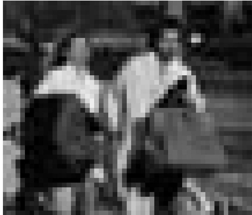
Une affaire qui s'est ébruitée. Nathalie Baye et Edouard Baer dans « Passe-Passe ». Nouveau à l'Utopia.

✖✖ Im Film (...) ist manches skurril, dafür entschädigen uns die Coen-Brüder mit knisternder Spannung. Und mit wunderbaren Aufnahmen