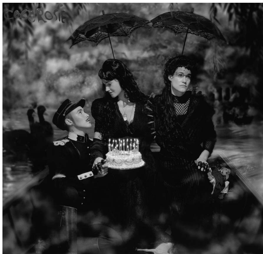
Cocorosie et leur petite planète atterriront à la Kulturfabrik, mardi le 13 mai.

Locked In et Love Scenes , visite guidée Op ee Sprong, Casino Luxembourg - Forum d'art contemporain, Luxembourg, 12h30. Tél. 22 50 45.