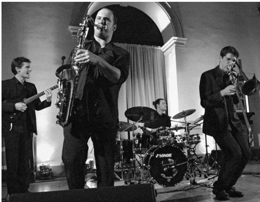
„Gemeinsam“ lautet die Devise der Jazz-Formation Ozma, die am 15.5 in der Trierer Tufa auftritt.