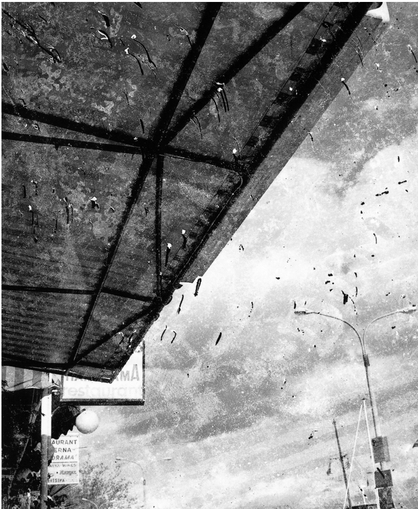
« Athènes-Bruxelles »: à partir de ce vendredi 6 juin, Luc Ewen expose trois séries de photographies au Pavillon du Centenaire à Esch-sur-Alzette.

Natur Musée (25, rue Münster, tél. 46 22 33-1), Luxembourg, ma. - di. 10h - 18h. Musée national d'histoire et d'art (Marché-aux-Poissons, tél. 47 93 30-1), Luxembourg, ma., me., ve. - di. 10h - 17h, je. nocturne jusqu'à 20h. Musée d'Histoire de la Ville de Luxembourg (14, rue du St-Esprit, tél. 47 96 45 00), Luxembourg, ma., me., ve. - di. 10h - 18h, je. nocturne jusqu'à 20h. Musée d'Art Moderne Grand-Duc Jean (Park Dräi Eechelen, tél. 45 37 85-1), Luxembourg, lu., je. - di. 11h - 18h, me. nocturne jusqu'à 20h. The Family of Man (montée du Château, tél. 92 96 57), Clervaux, ma. - di. 10h - 18h.