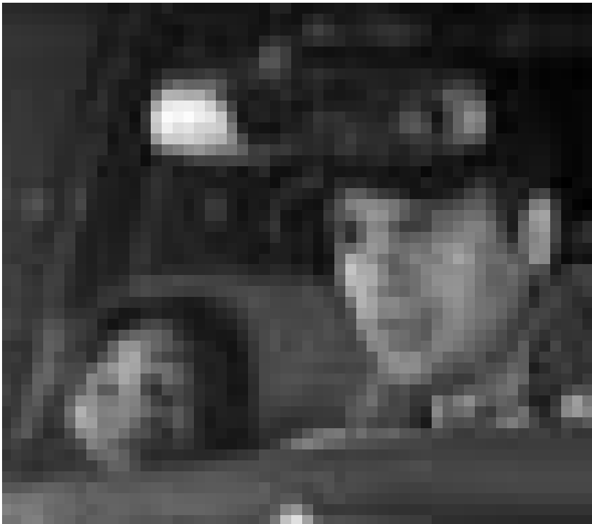
Verliert seinen Sohn durch die Unachtsamkeit eines anderen. Joaquin Phoenix in „Reservation Road“. Neu im Utopolis.

Ariston, Sa. - Di. + Do. 14h (dt. Fass.). Siehe unter Luxemburg.