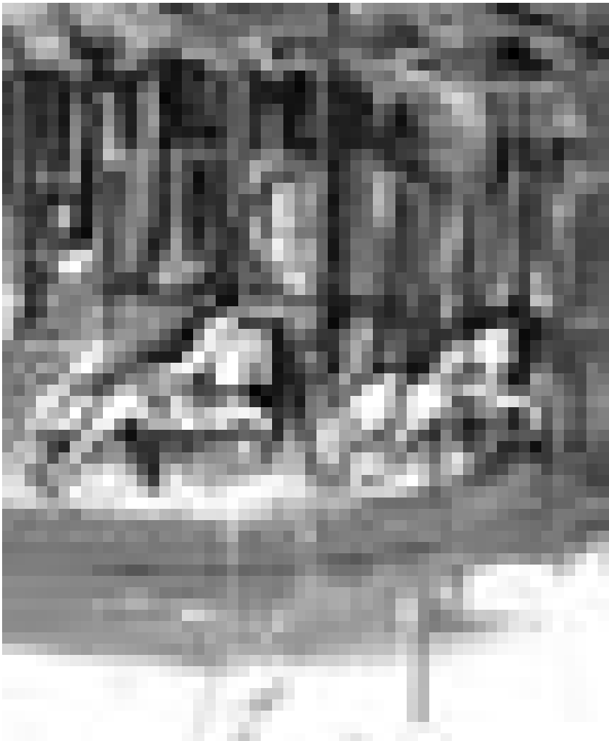
Basic Instinct : Mireille et Marco Weiten-de Waha exposent leurs peintures jusqu'au 27 avril au château de Bettembourg.

Colette Deyme Crid'Art (bois de Coulange, tél. 0033 3 87 17 22 22), jusqu'au 4.5, tous les jours 13h30 - 19h.