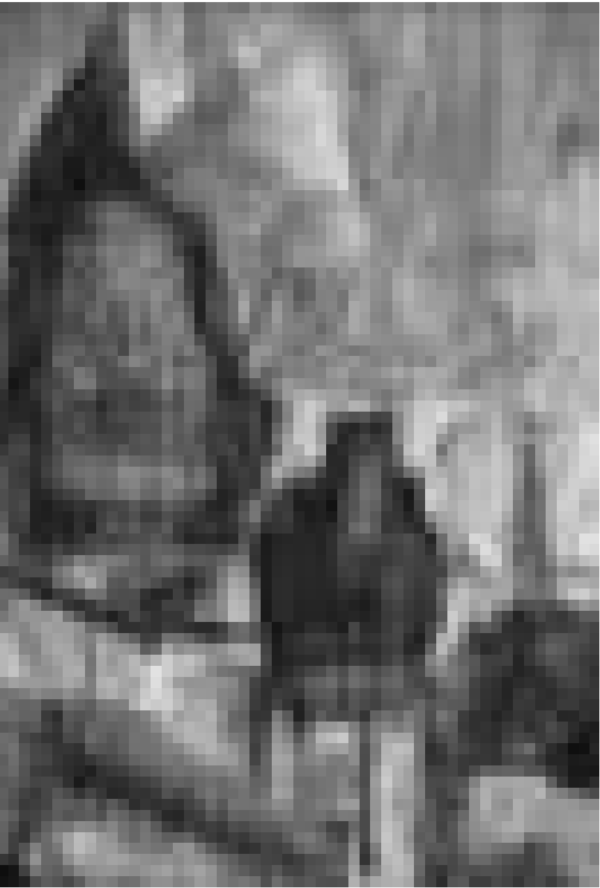
Fusions : les collages d'Angèle Barquin et...

Banque Centrale du Luxembourg bâtiment Monterey, 43, avenue Monterey, tél. 47 74-1), jusqu'au 30.4, lu. - ve. 10h30 - 16h.