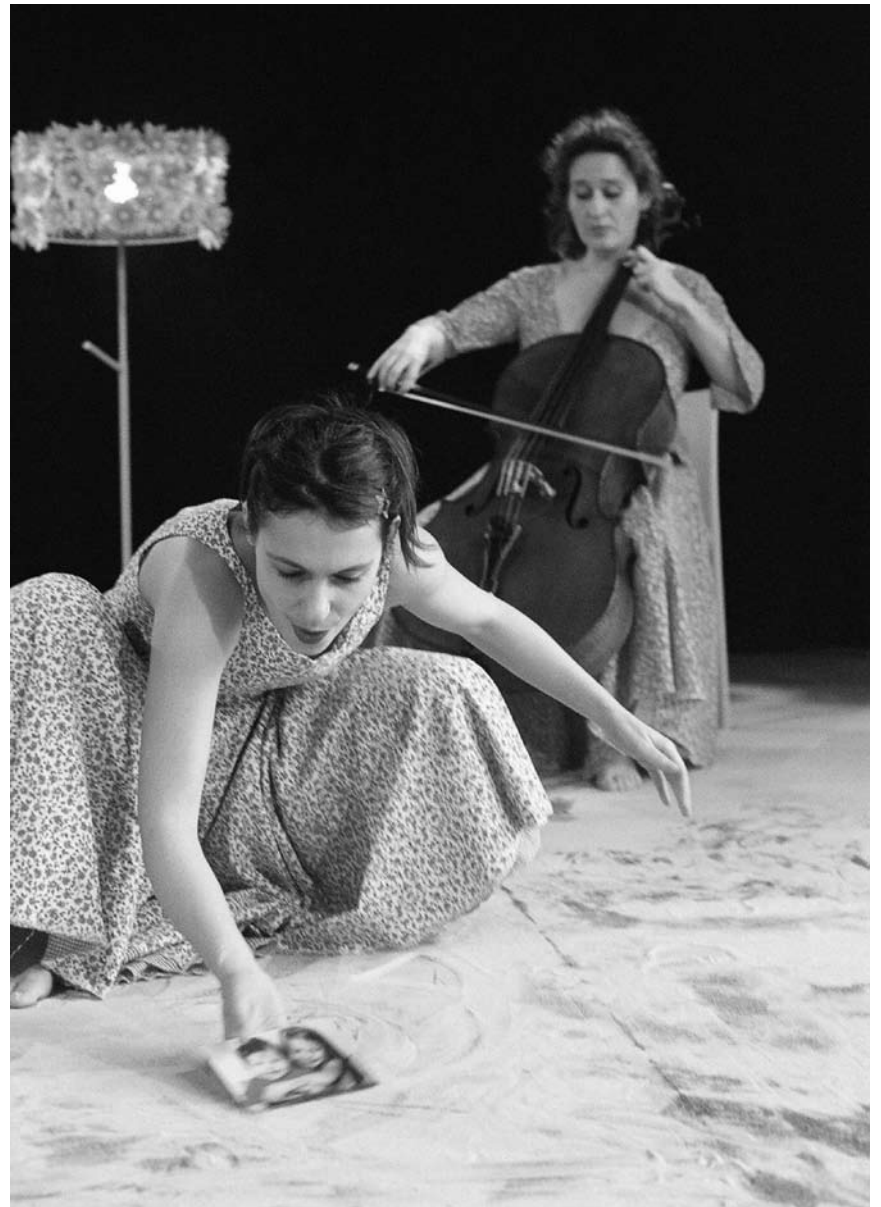
« Bach à sable » permettra au tou-te-s petit-e-s de deux à quatre ans un premier contact avec la danse et la musique. Au Mierscher Kulturhaus les 10, 11 et 12 juin.

This Amazing Place + Joey Jeremiah + No More No Less + Julien , Les Trinitaires, Metz , 18h. Tél. 0033 3 87 75 75 87.