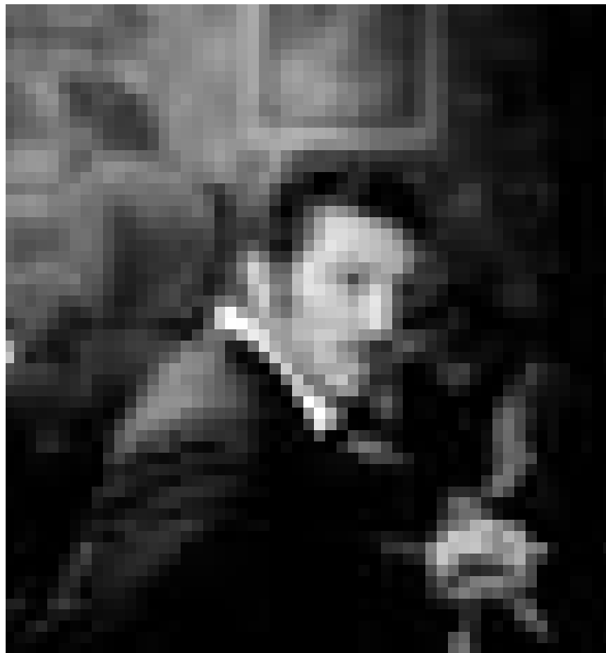
Gangster aussi controversé que brutal: Jacques Mesrine a marqué l'imagination de son temps.

Naples et la Campanie - Gomorra aux mains de la Camorra. Nous assistons à quelques jours de la vie des habitants de ce monde impitoyable. Sur fond de guerres de clans et de trafics en tous genres, Gomorra raconte les destins croisés de Toto, Don Ciro et Maria, Franco et Roberto, Pasquale, Marco et Ciro. Cette fresque brutale et violente décrit avec précision les cercles infernaux de la Camorra napolitaine. XXX Plus qu'un film « sur la mafia ». Cette oeuvre nous plonge dans ce quart-monde européen et révèle les vrais ressorts de la Camorra : la misère et la violence. (dv)