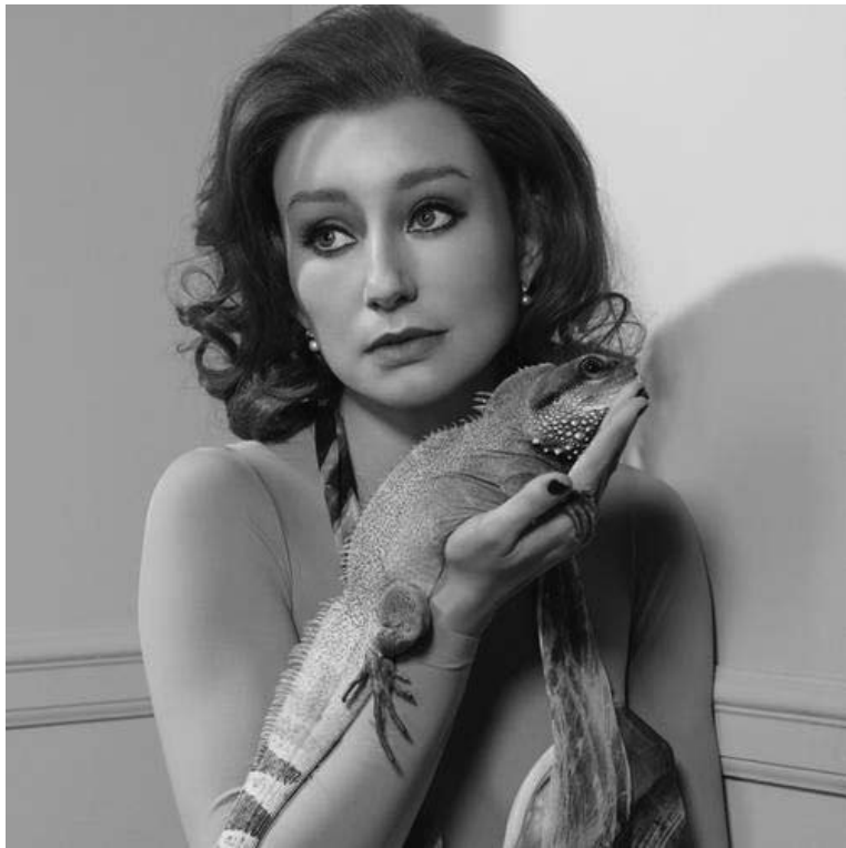
Auf Schmusekurs mit einem Chamäleon: So vielfältig und auch ein bisschen anrühlich ist Tori Amos' neues Album „Abnormally Attracted to Sin“