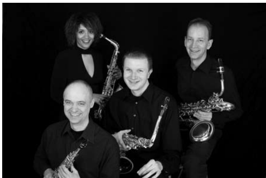
Den Teddy a seng Déieren: Am Kader vun de „Musicroissants“ spillt de Quatuor de Saxophones dëse Sonndeg, 20. September zu Niederanven am Kulturhaus.

Kenny Wheeler, Diana Torto & Blue Orchestra , jazz, Trifolion, Echternach, 20h. Tel. 47 08 95-1.