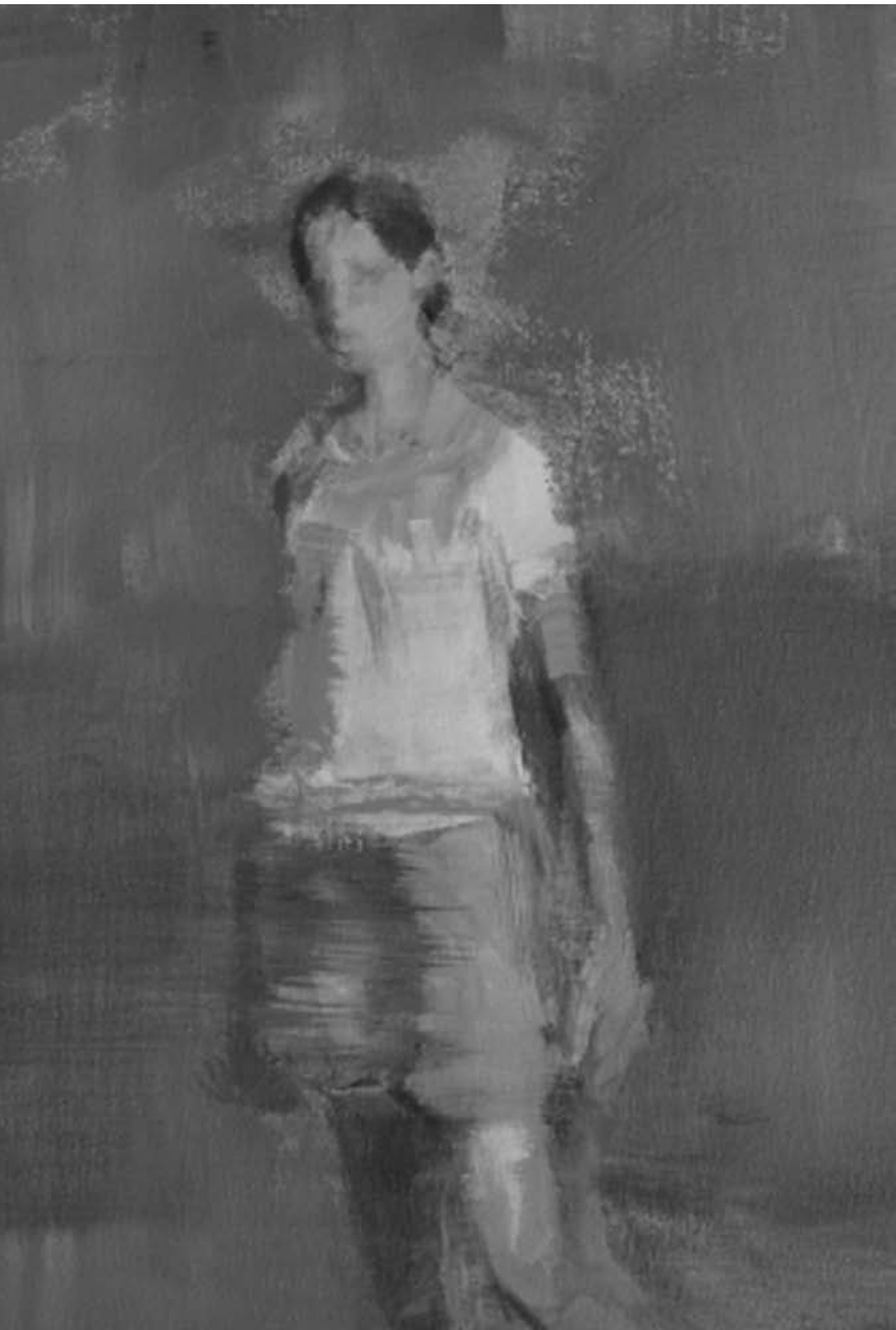
Leen Van Bogaert expose une série de portraits intimistes d'adolescents et, en contrepoint, une petite série d'esquisses instantanées de mouvements saisis sur le vif, au Kulturhaus de Niederanven.

art religieux, croyances populaires, légende ardennais, Musée en Piconrue (24, place St-Pierre, tél. 0032 61 21 56 14), jusqu'au 3.1.2010, ma. - di. 10h - 18h.