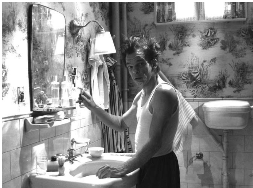
Découvrez l'acteur, comédien et narrateur français Denis Lavant lors de la soirée cinéma du 8 octobre à la Kulturfabrik.

Le Mardi à Monoprix , d'Emmanuel Darley, avec Jean-Claude Dreyfus,