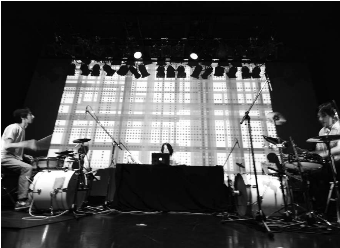
Images et sons se rencontreront ce vendredi à l'Exit07.