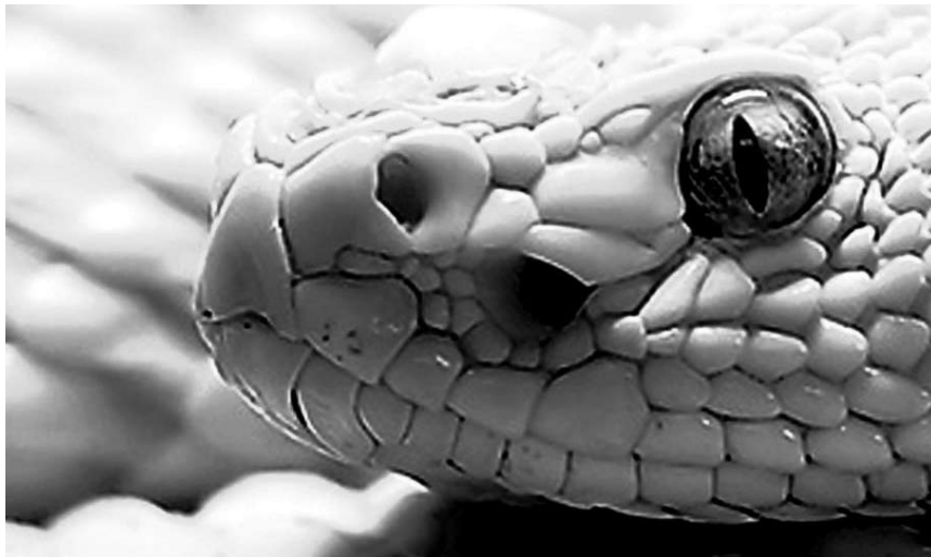
Un Timon d'Athènes qui met des baskets à Shakespeare : le projet réunit comédiens, rappeurs, slameurs et un musicien le 7, 9 et 10 octobre à la Kulturfabrik.

Behemoth, Samael, Mass Hysteria, Chimaira, Uneath, Throwdown, Daath, Sonic Syndicate, Shining, Crucified Barbara, Trepalium et Gorod, Les Arènes (Palais Omnisports), Metz, 13h.