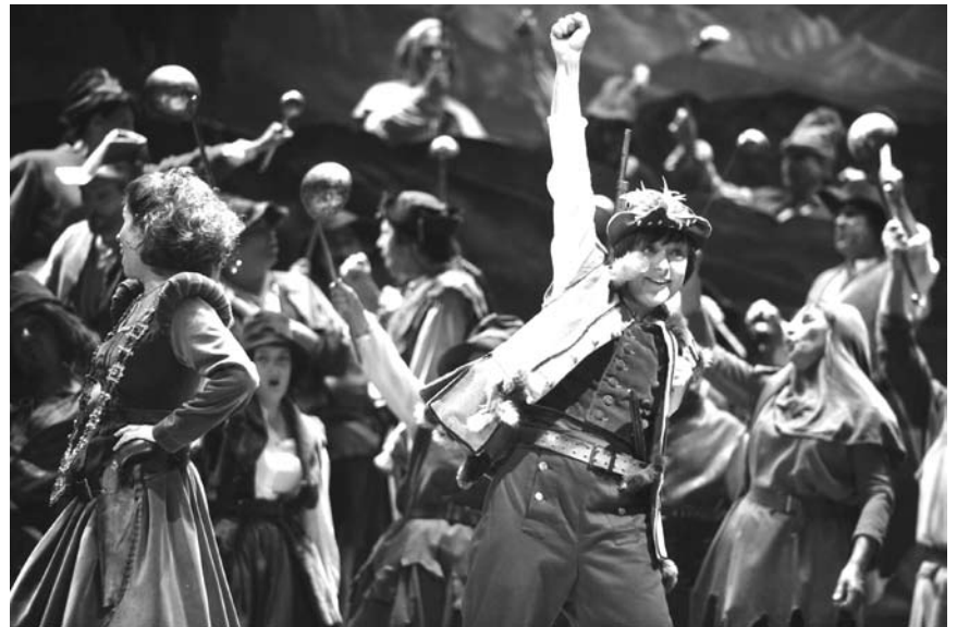
La vie de voleur semble n'être qu'une grande fête : Les Brigands, opéra de Jacques Offenbach au Grand Théâtre de Luxembourg les 9, 11 et 13 octobre.