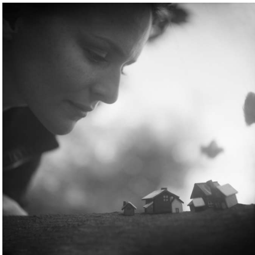
Scheint Luxemburg zu mögen: Emiliana Torrini ist am 16. Oktober im hauptstädtischen Atelier zu Gast - schon zum zweiten Mal.