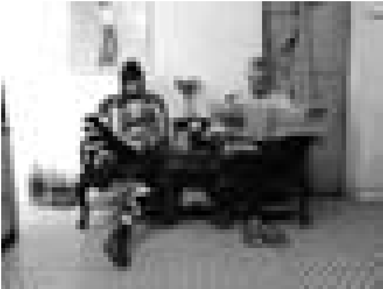
Auch Superhelden langweilen sich zu Hause : Die Ausstellung „Everyday(s)“ im Casino nimmt sich dem Alltag an, ob nun in China oder ...

„Schade dass der Zuschauer (...) nicht mehr über die Umstände und Schaffensbedingungen von Kutter erfährt (...).“ (cw)