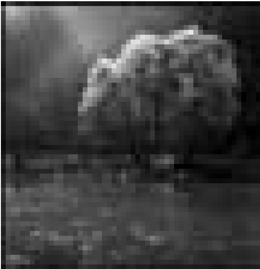
C'est le printemps... aussi dans la Maison de la Culture d'Arlon, qui expose les photographies de Dieudonné Andrien à partir du 2 avril.