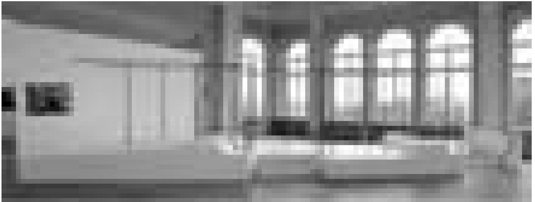
... in Israel - wie Carmit Gils imposante Bus-Skulptur aufzeigt. Noch bis zum 11. April.