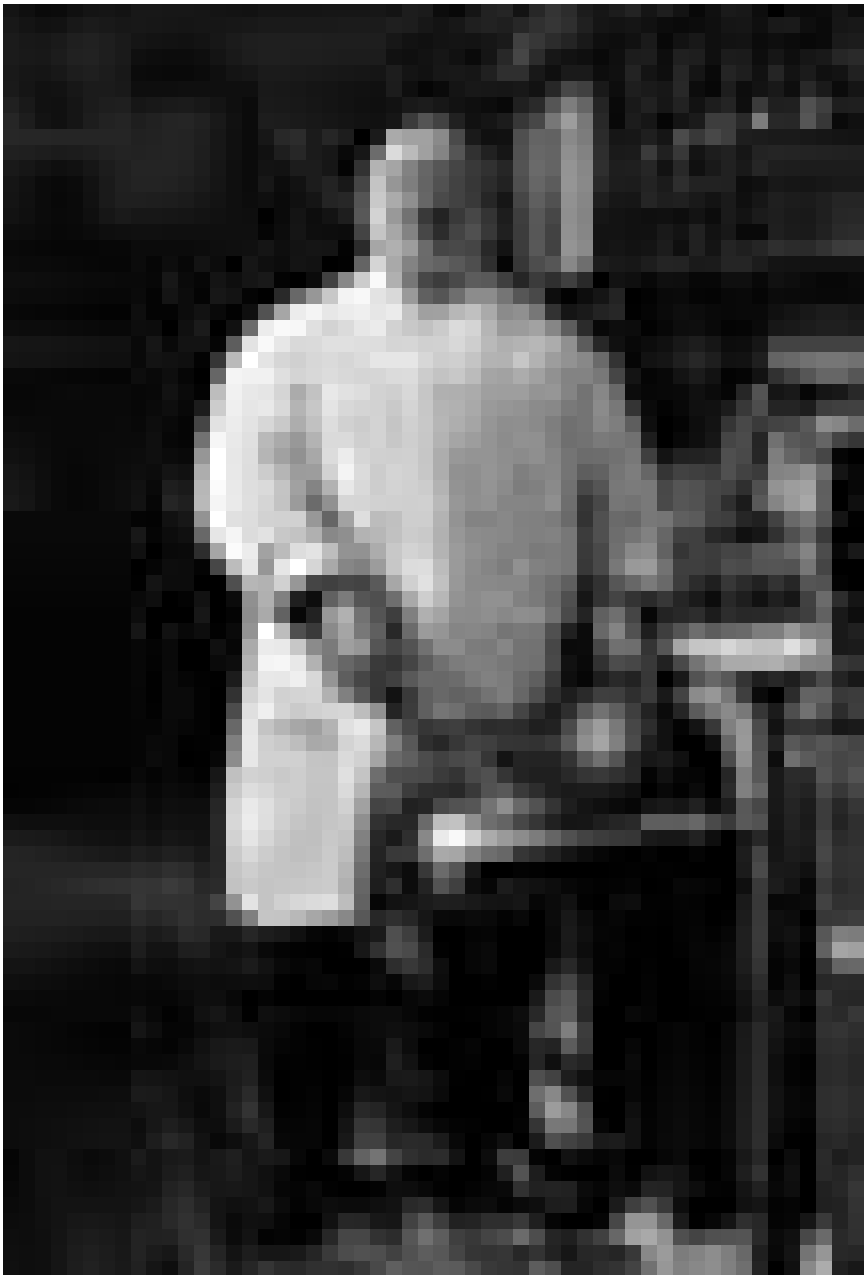
Das 20. Jahrhundert ist noch nicht so lange Geschichte, und doch kommen uns diese Bilder schon so fern vor: August Sanders Fotografien über „Menschen des 20. Jahrhunderts“ sind noch bis zum 26. September im CNA zu sehen.