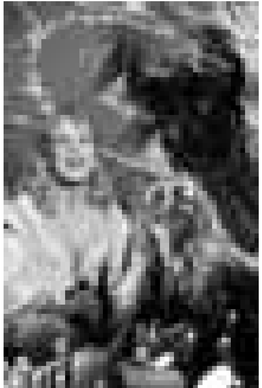
So biestig sieht es dann nun aber nicht aus: „Die Schöne und das Biest“, Musical im Freilichttheater in Wiltz, am 23. Juli, im Rahmen des Festivals.