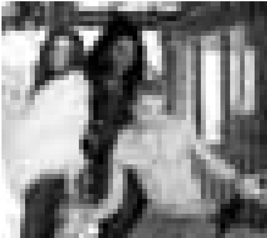
Nach den zig Fortsetzungen, nun auch noch die Verarsche der Twilight Serie ... „Vampires Suck“, neu im Utopolis.

Eis, erkennt der junge Aang, der das Element Luft beherrscht, dass er die Macht besitzt, alle vier Elemente zu beeinflussen.