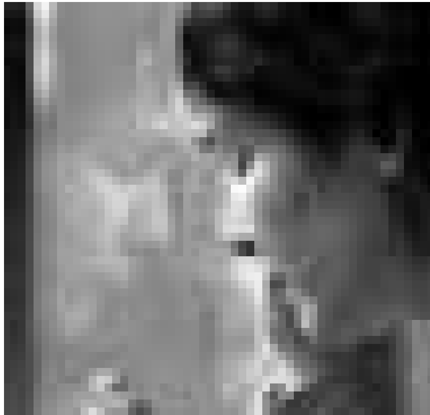
L'inhumanité des expulsions et des traques à l'étranger : « Illégal », avant-première, jeudi à l'Utopolis.