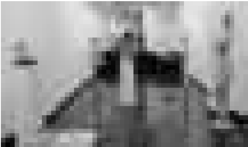
Plus qu'une chose à dire : « Unique Visual Statement » de Kingsley Ogwara - à la galerie Armand Gaasch à Dudelange, encore jusqu'au 17 octobre.

La Belgique dans tous ses états NEW peintures, Espace Beau Site (321, avenue de Longwy, tél. 0032 63 22 71 36)), du 16.10 au 13.11, lu. - ve. 9h - 18h30, sa. 9h30 - 17h.