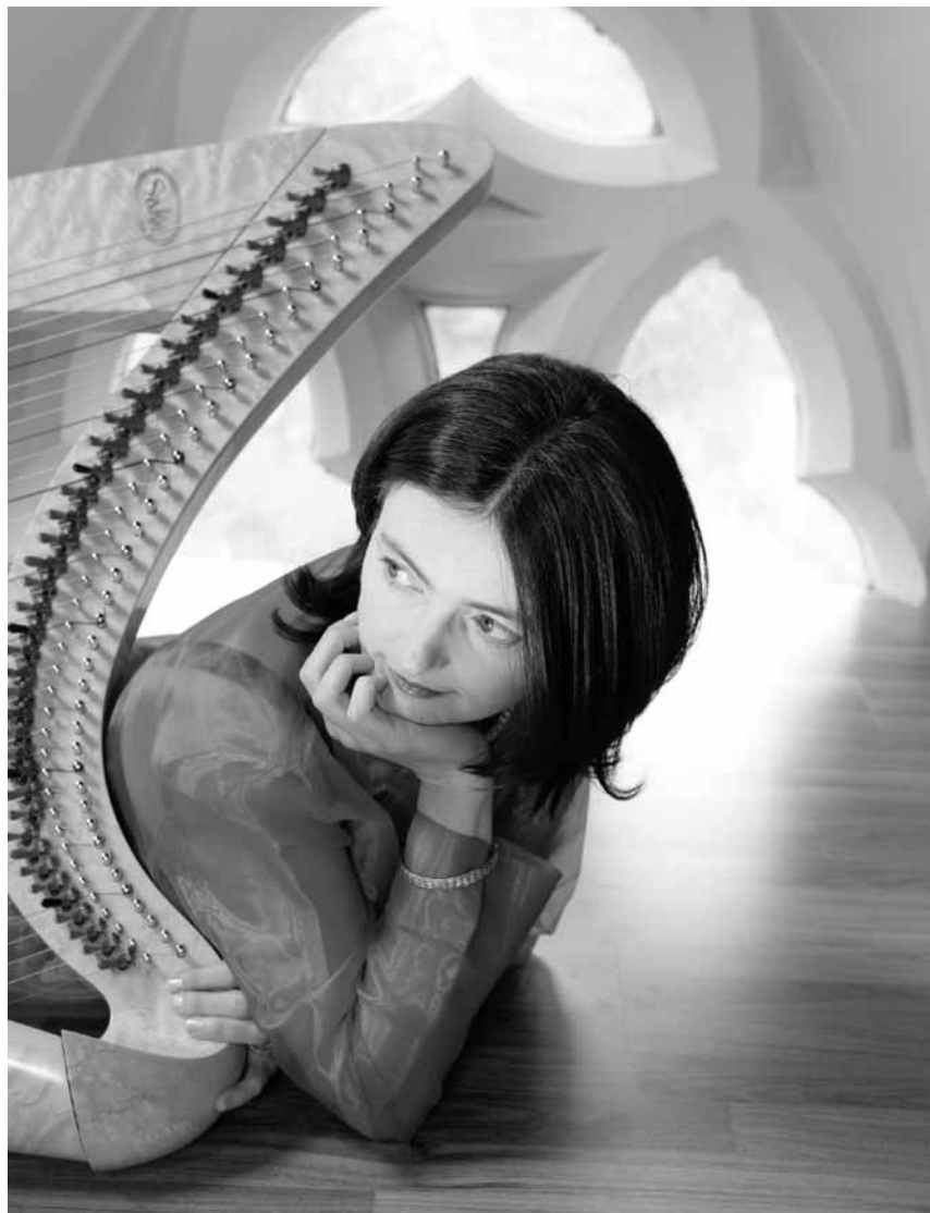
La harpe et l'orgue seront au rendez-vous pour inaugurer le festival de musique celtique : « Celtic Prelude », à l'église Saint-Martin de Dudelange, le 10 mars.

Et ass eemol , Atelier fir Kanner vu sechs bis zwoelef Joer, Casino Luxembourg - Forum d'art contemporain, Luxembourg , 15h. Tel. 22 50 45.