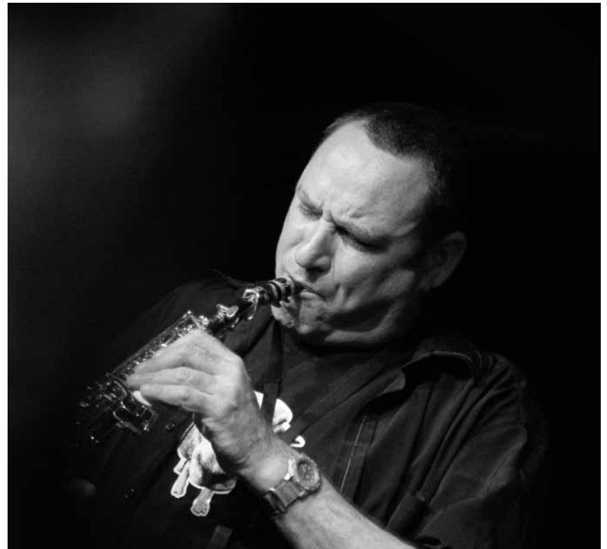
Un maître du jazz oriental : « Gilad Atzmon & The Orient House Ensemble », le 8 mars à la brasserie L'Inouï à Rédange.