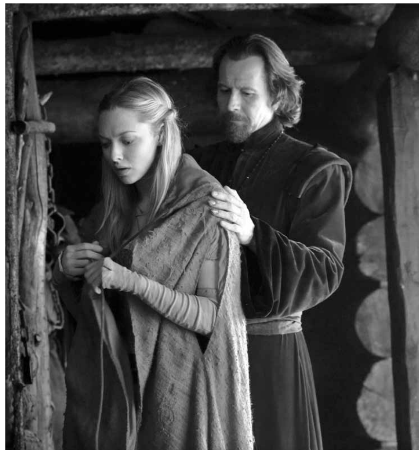
Der Wolf im Schafspelz? „Red Riding Hood“ ist eine teengerecht aufbereitete Werwolf-Horrorvariante. Neu im Utopolis und CinéBelval.

L'italien Alessandro, professeur de musique baroque, vit à Strasbourg avec Irina, sa fille de 15 ans, et son frère Crampone, un anarchiste qui ne cesse de demander le statut de réfugié politique depuis que Berlusconi est au pouvoir. Au moment où sa fille découvre les premiers émois de l'amour, tout va basculer pour Alessandro.