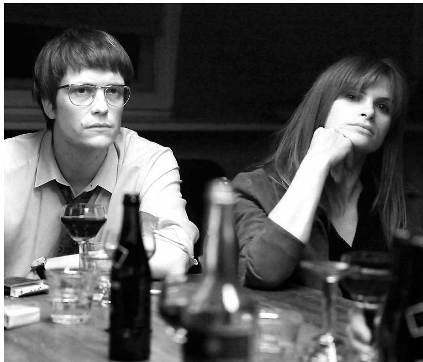
Die Vorgeschichte der RAF mal anders: In „Wer wenn nicht wir“ gehen Erotisierung und Militarisierung Hand in Hand. Zu sehen im Kino Starlight.