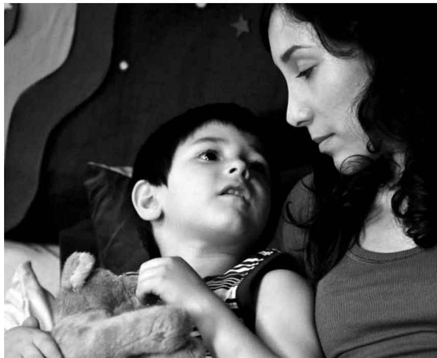
Die Zerrissenheit der Figuren ist in „Die Fremde“ durchgängig spürbar. Ein Film, der einen schwierigen Neuanfang thematisiert. Neu im Utopia und im Ariston.

Le 1er janvier 1993, deux douaniers, l'un Belge francophone, l'autre Français, apprennent la disparition prochaine de leurs postes. Le Belge Ruben Vandervoorde et le Français Mathias Ducatel, voisins de douane et ennemis de toujours, se voient contraint d'inaugurer la première brigade volante mixte franco-belge. ☼ Un ping-pong verbal à base de clichés éthnocentriques. Malheureusement le tout n'est pas vraiment original. (cw)