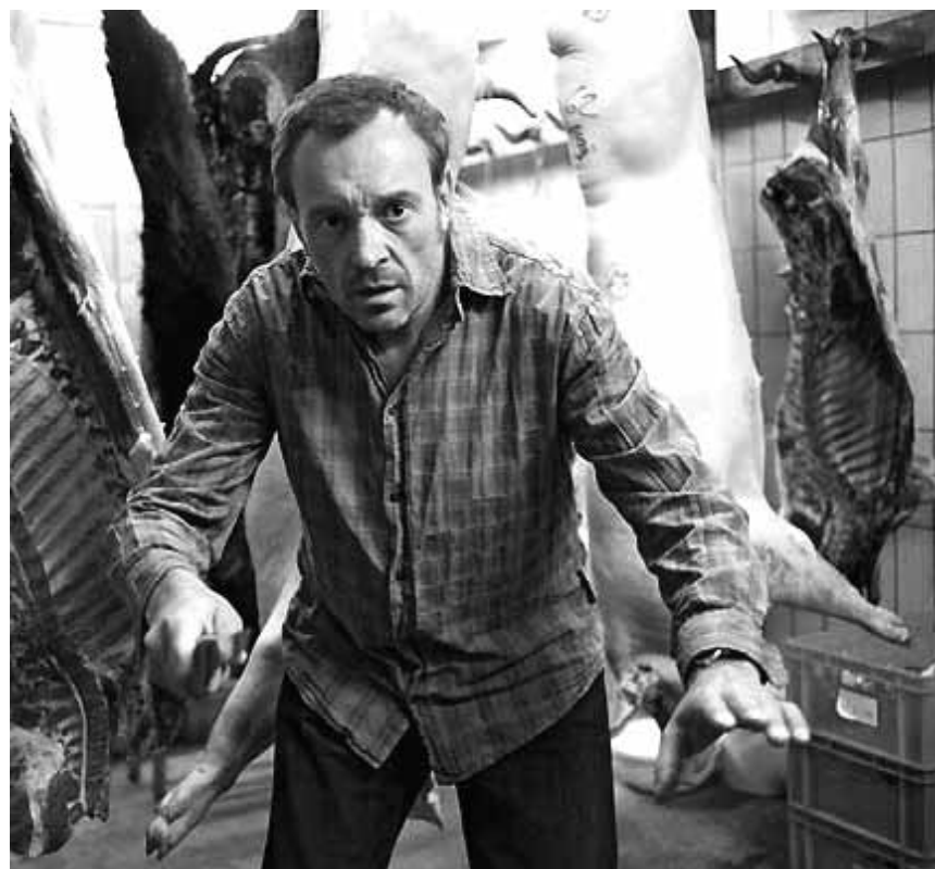
Ob da immer nur richtige Schweine hängen ? „Der Knochenmann“ deckt es auf - am Mittwoch im Utopolis. Im Rahmen des „Discovery Zone“-Festivals.

Victor und Rudi haben vor Ausbruch des Zweiten Weltkrieges gemeinsam ihre Kindheit und Jugend verbracht.