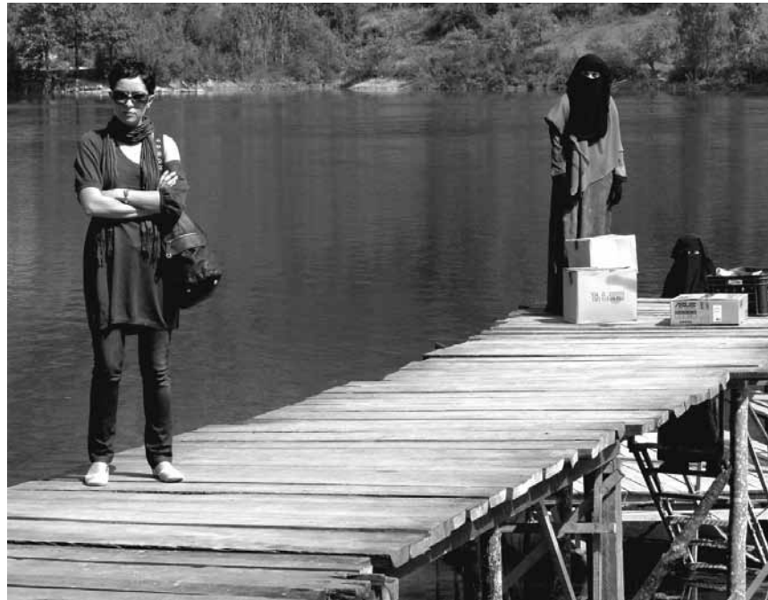
La guerre laisse des traces même 15 ans plus tard : « Na Putu », vendredi à la Cinémathèque et samedi à l'Utopia, dans le cadre du festival « Discovery Zone ».

• „Rien à déclarer“ vum Dany Boon, Samsdeg um 20h