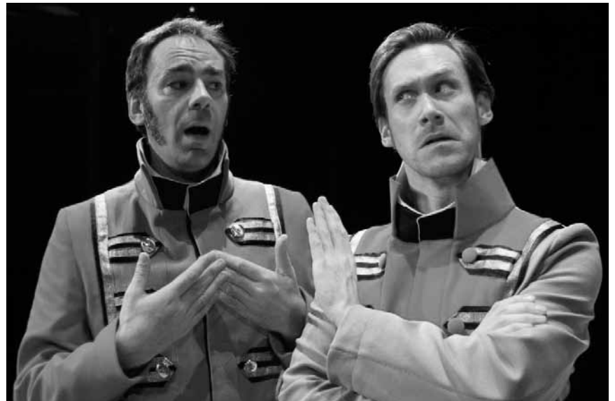
Une comédie non sans contenu : « Much Ado about Nothing », par le TNT Theatre Britain, dans la cour du château de Bourglinster le 4 juillet.