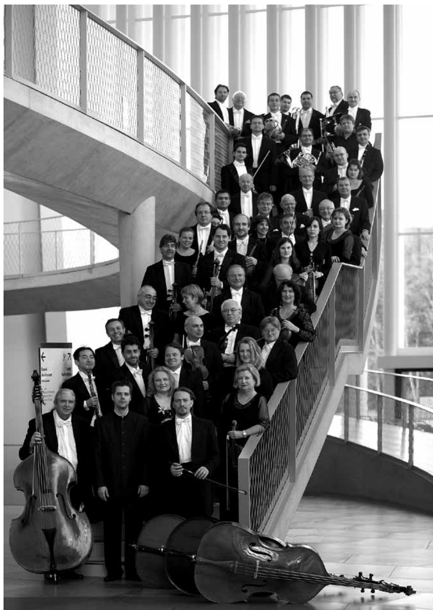
Ne sont pas vraiment solitaires : « Les solistes européens » seront en concert au Théâtre en plein air du château de Wiltz le 9 juillet.