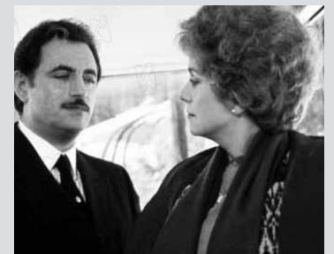
Vendredi, Richard Bohringer et Catherine Deneuve, dans « Agent trouble ».

dans le patio du Théâtre des Capucins, du 8 juillet au 13 août, tous les vendredis et samedis à 22h, entrée gratuite.