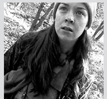
Samedi, « The Blair Witch Project ».

GB/F/L/NL 1996 von Peter Greenaway. Mit Vivian Wu, Ewan McGregor und Ken Ogata. 126'. O.-Ton fr. Ut.