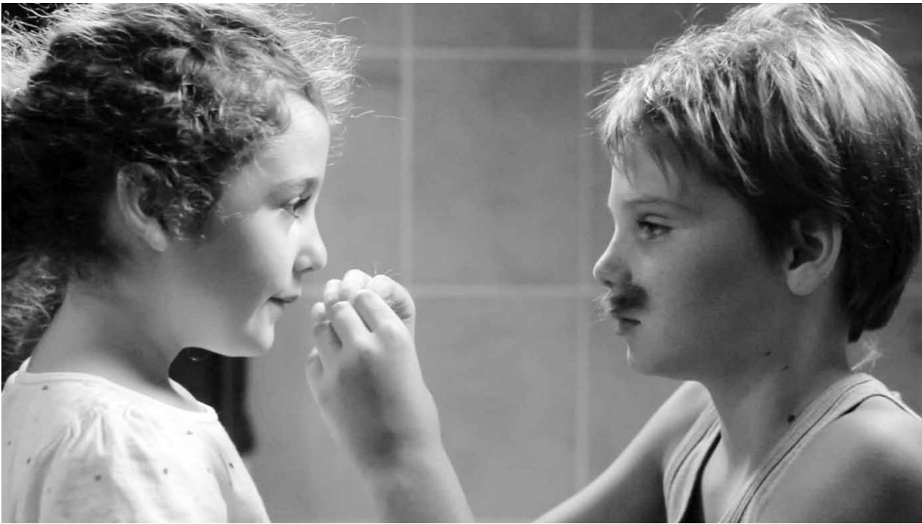
La recherche de l'identité passe aussi par le jeu...