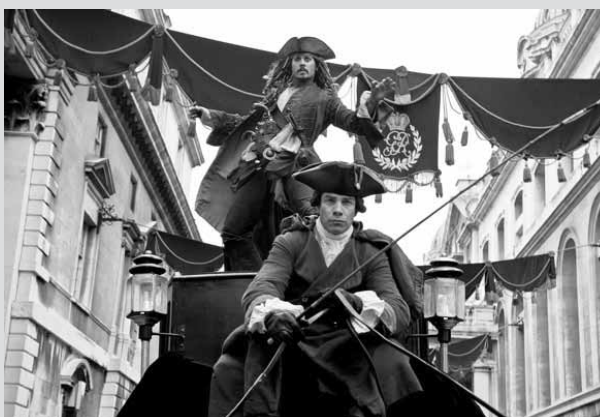
Pirates of the Caribbean : On Stranger Tides