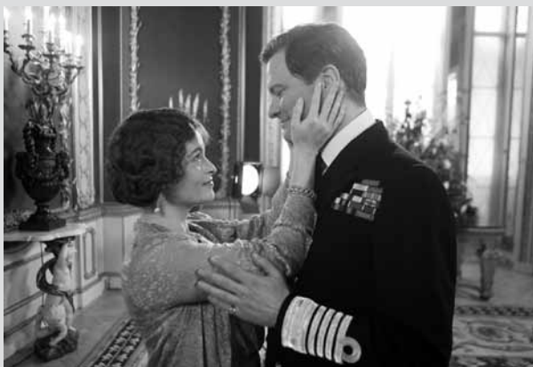
The King's Speech

Montag The King's Speech , GB/AU 2010, 118', O.-Ton fr. + nl. Ut., ab 12. Dienstag Four Lions , GB 2010, 101', O.-Ton, fr. + nl. Ut., ab 12. Mittwoch Pirates of the Caribbean: On Stranger Tides , USA 2011, 141', dt. Fass., ab 6. Donnerstag Larry Crowne , USA 2011, 99', dt. Fass., ab 6