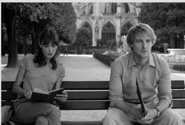
Midnight in Paris

Freitag Cars 2 , USA 2011, 106', O.-Ton, fr. + nl. Ut., Kinderfilm Samstag Hangover 2 , USA 2011, 102', dt. Fass., ab 12. Sonntag Midnight in Paris , USA 2011, 100'. O.-Ton, fr. Ut., ab 6.