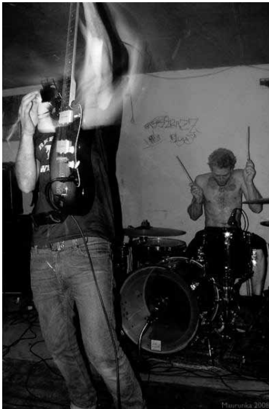
Le dernier show du collectif Schalltot pour la saison : les Danois d'Obstacles y côtoieront Fago Sepia, le 22 juillet au café Rocas.

An de Labränten , 10. Fräiliichtspektakel vun der Schankemännchen asbl mat 60 Akteuren, Text vum Jemp Schuster,