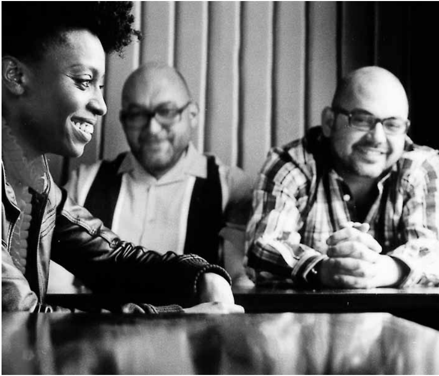
Wieder auf Achse: die drei Trip Hopper von Morcheeba.