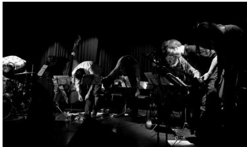
Ils sont huit et font du jazz et on peut les découvrir à l'abbaye de Neumünster, le 24 juillet : Octet Red.

Dance Party , avec DJ Phillips, Café Ancien Cinéma, Vianden , 22h. Tel. 26 87 45 32.