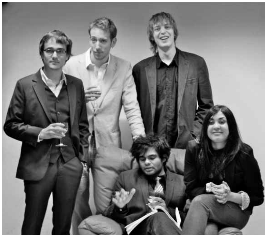
Les Birdbones sont un des groupes qui feront le plaisir des festivaliers estivaux qui trouveront le chemin de Beaufort pour le « Rock The Castle », le 24 juillet.

WAT ASS LASS | 15.07. - 24.07. / ERAUSGEPICKT