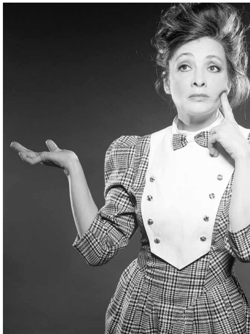
Désormais elle sera seule sur scène, mais on peut être sûr de passer une soirée inoubliable le 1er juin à l'Atelier avec Catherine Ringer des légendaires Rita Mitsouko.