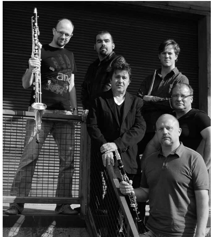
Descendront de leur tour d'ivoire : L' « Ebony Quartet », jouera à l'Abbaye de Neumünster, ce vendredi 27 mai et ce samedi 28 mai à l'Arsenal de Metz.