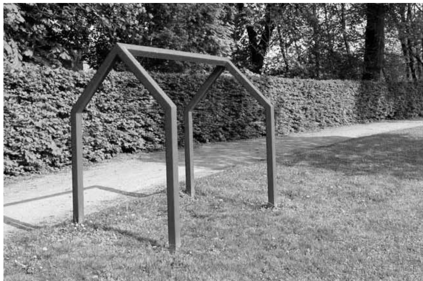
Une cabane peut en cacher une autre : « Pays'arbres : La cabane au bout du jardin », exposition collective dans le parc Elisabeth de Bastogne, jusqu'au 28 août. Vernissage ce dimanche 3 juillet.