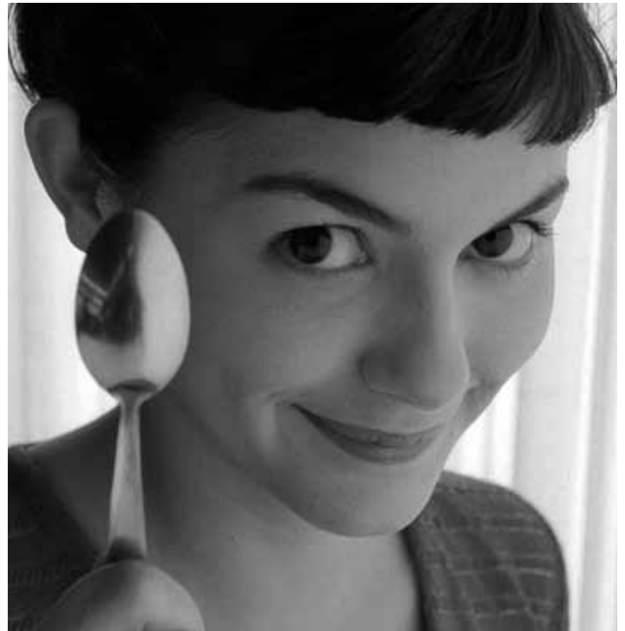
La meilleure campagne de pub pour la ville de Paris de tous les temps : « Le fabuleux destin d'Amélie Poulain », samedi à la Cinémathèque.

Une jeune et brillante stagiaire du FBI, Claire Starling, entre en contact avec le docteur Lecter, fou cannibale incarcéré dans un asile d'aliénés. Elle espère ainsi rassembler les indices qui la mettront sur la piste d'un tueur psychopathe qui dépèce ses victimes.