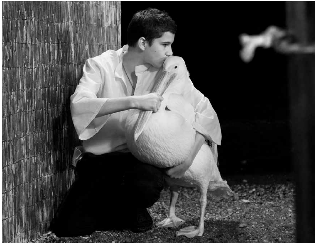
L'amour pour le pélican va révéler l'amour de son paternel : « Nicostratos, le pélican », nouveau à l'Utopia.

Polizeiaгент Brant soll einen Serienkiller jagen, dem bereits einige Polizisten zum Opfer gefallen sind, und der nach dem Angriff der deutschen