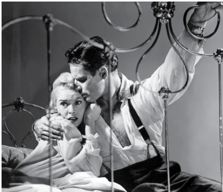
Un classique du polar de et avec Orson Welles, Charlton Heston et Janet Leigh : « Touch of Evil », jeudi à la Cinémathèque.