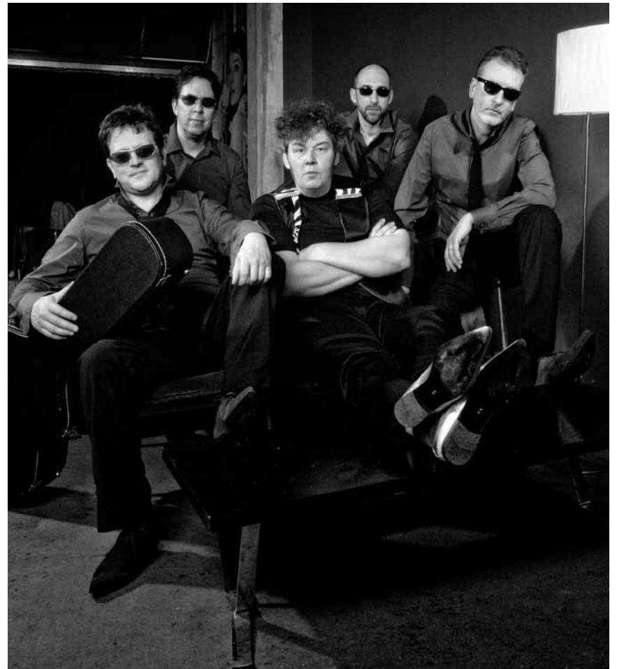
Mit Sonnenbrille und Instrument - so entspannt sind nur „The Convertibles“. Zu sehen am 19. August in Differdange.