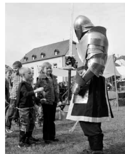
Am 18. September reist die Gemeinde Koerich zurück in finstere Zeiten mit dem alljährlichen Mittelalterfest auf dem Gréiveschlass.

Visites guidées , Musée du jeu de cartes Jean Dieudonné (Kulturhuf),