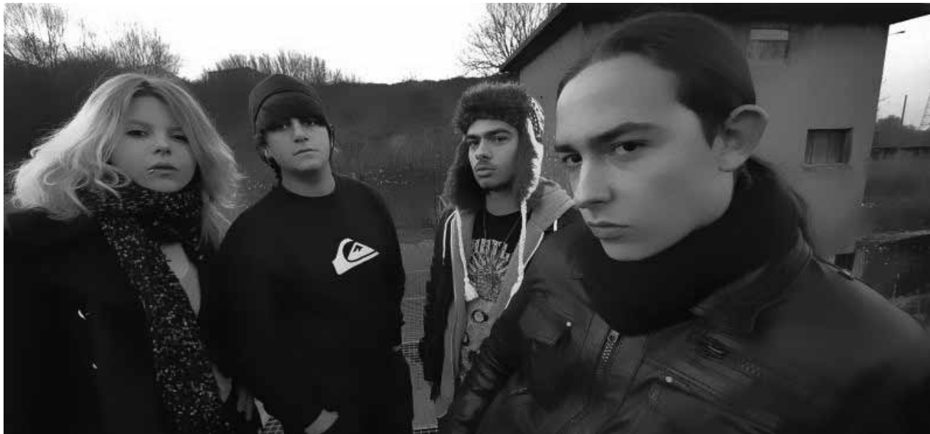
La première release de la nouvelle saison à la Rockhal sera Lost in Pain.