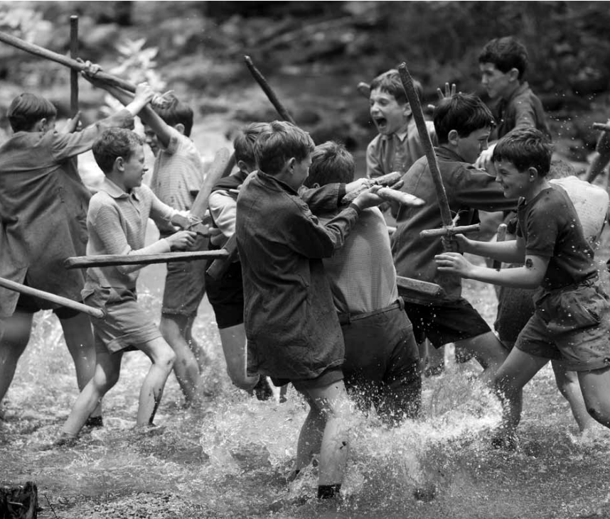
D'après le roman de Louis Pergaud : « La guerre des boutons », nouveau à l'Utopolis et au CinéBelval.

Nach einem Vollrausch erwacht sie neben Dex, einem alten Schwarm aus ihrer Jura-Ausbildung. Dummerweise ist der mit ihrer besten Freundin Darcy verlobt.