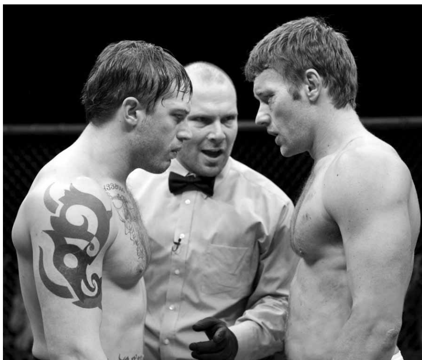
Geschwisterliebe sieht anders aus: „Warrior“, neu im Utopolis und im CinéBelval.