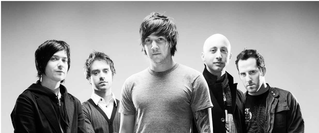
Zu nett für diese Welt?