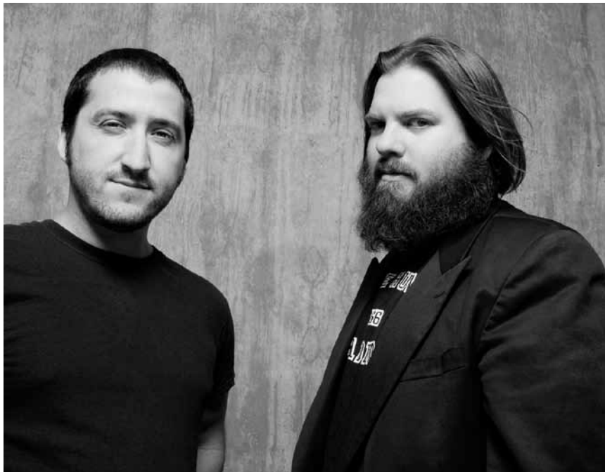
Verborgene Indie-Götter: Pinback.