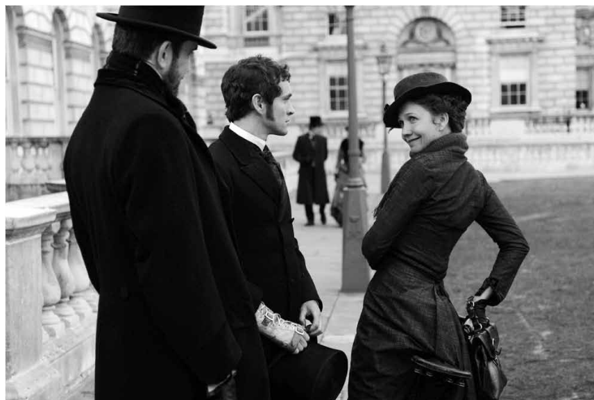
Hysterie und Psychoanalyse liegen nah beieinander: „Hysteria“, neu im Utopolis.

Été 1971. Anna, jeune mère ravissante et frivole, remporte le concours de beauté d'une station balnéaire. Son tempérament inconséquent et joueur rend sa vie de famille quelque peu chaotique. 30 ans plus tard, toujours marqués par cette