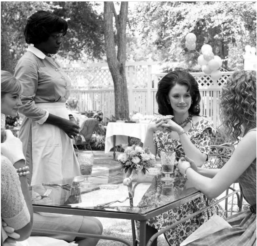
Der alltägliche Rassismus weicht langsam aber sicher auf... Zumindest in „The Help“, Vorpremiere am Donnerstag im Utopolis.

I Wish I Knew CHINA 2010, Dokumentarfilm von Zhang Ke Jia. 125'. O.-Ton, fr. + nl. Ut. Ab 12. Utopia, Mi. 19h, Do. 21h. Shanghai-Dokumentation, in der Interviews mit chinesischen Prominenten, die über ihre Beziehung zur Stadt sprechen mit zwischengeschnittenen Impressionen aus dem Leben der Megastadt alternieren.