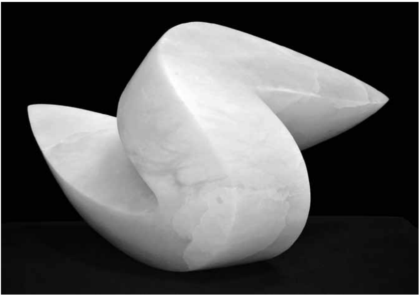
L'agence BGL BNP Paribas accueille jusqu'au 27.2 au sein de ses locaux une exposition de sculptures en albâtre de Tom Flick.

Ronan et Erwan Bouroullec Centre Pompidou (1, parvis des Droits de l'Homme, tél. 0033 3 87 15 39 399), jusqu'au 30.7, lu., me. + di. 11h - 18h, je. + ve. 11h - 20h, sa. 10h - 20h, di. 10h - 18h.