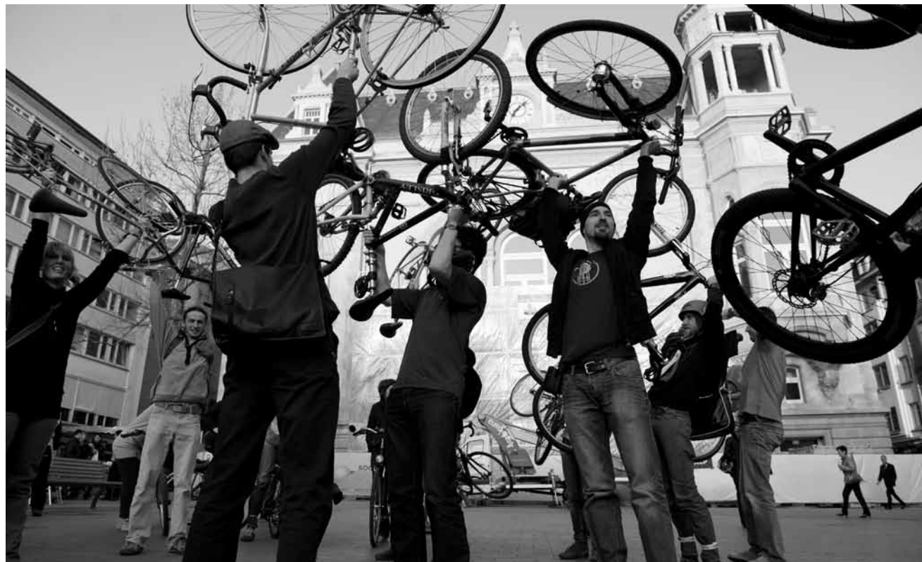
Hoch die Räder! An diesem Freitag, 30. April, versammeln sich RadfahrerInnen wieder zu einer „Critical Mass“. Treffpunkt 18h30 am Hauptbahnhof.

Out of the Crowd 9 , avec The Redneck Manifesto, Breton, Aucan, Le Club des Losers, Adebisi Shank, Rumble in Rhodos, Sun Glitters, Cyclorama et Mount Stealth, Kulturfabrik, Grande Salle, Esch, 15h30. Tél. 55 44 93-1.