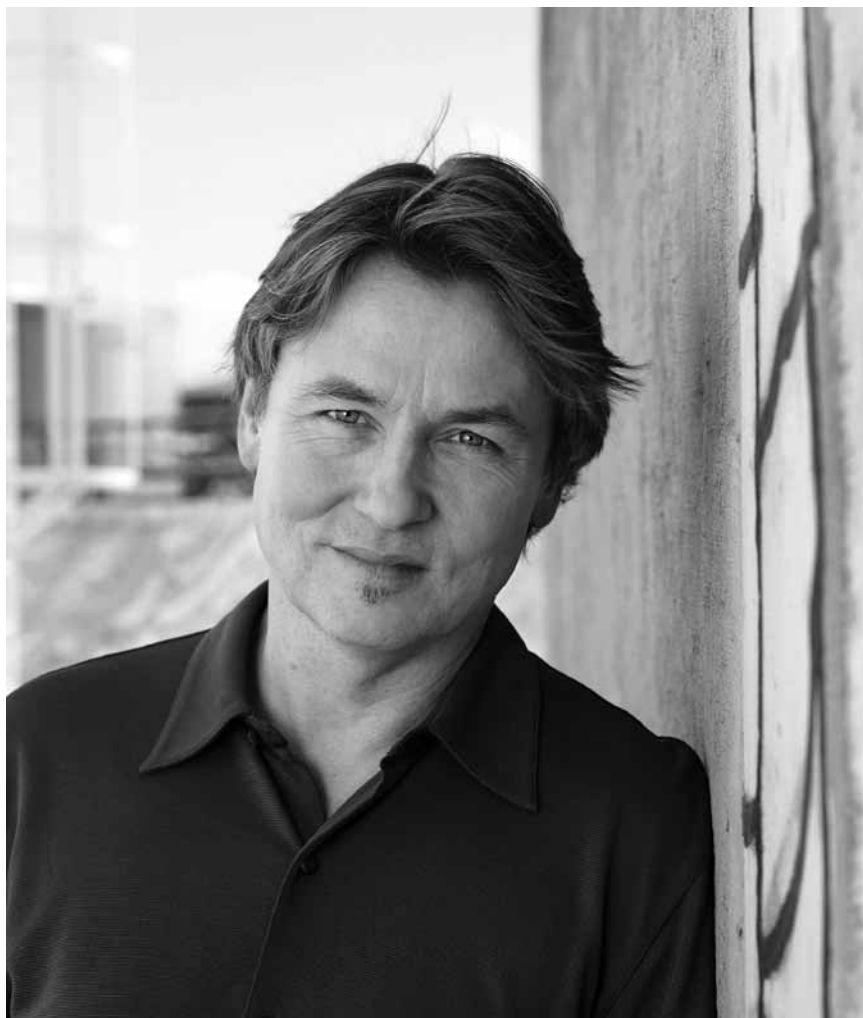
Esa-Pekka Salonen dirigera Sibelius, Beethoven et une pièce de son propre cru, le 7 avril à la Philharmonie, avec le Philharmonia Orchestra de Londres.

Parsifal , Oper von Richard Wagner, Saarländisches Staatstheater, Saarbrücken (D), 19h30. Tel. 0049 681 30 92-0.