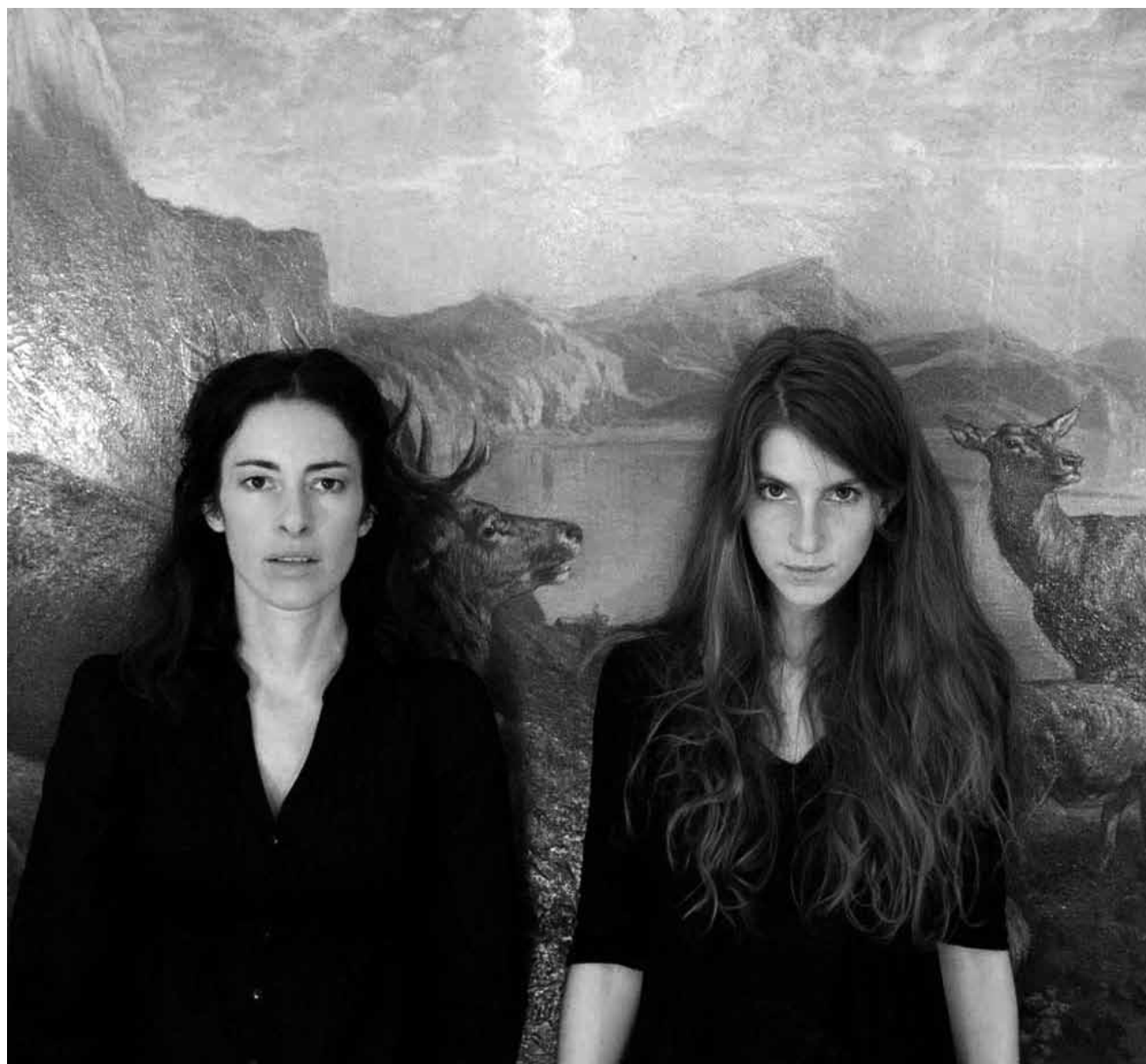
Zwei Frauen die sich „BOY“ nennen, ein wunderbarer Pop-Sound der die Ohren mit frischen Würmern verwöhnt und dann auch noch ein Live-Auftritt im Atelier am 4. April. Was will man oder frau mehr?

L'histoire de Luxembourg pour les nuls , présentation de l'exposition permanente et introduction à l'histoire de la ville et du pays, Musée d'Histoire de la Ville, Luxembourg, 16h. Tél. 47 96-45 70.