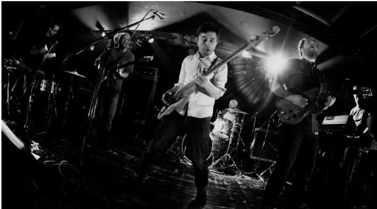
Vont faire chauffer la fin de soirée : The Redneck Manifesto