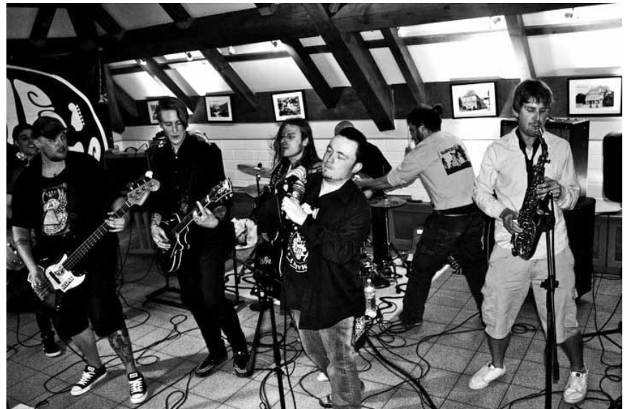
Ein bisschen nett sehen sie trotzdem aus : The Barcodes präsentieren am 31. März ihr neues Album „Nice Boys Don't Play Rock'n'Roll“, ab 21 Uhr im Melusina.