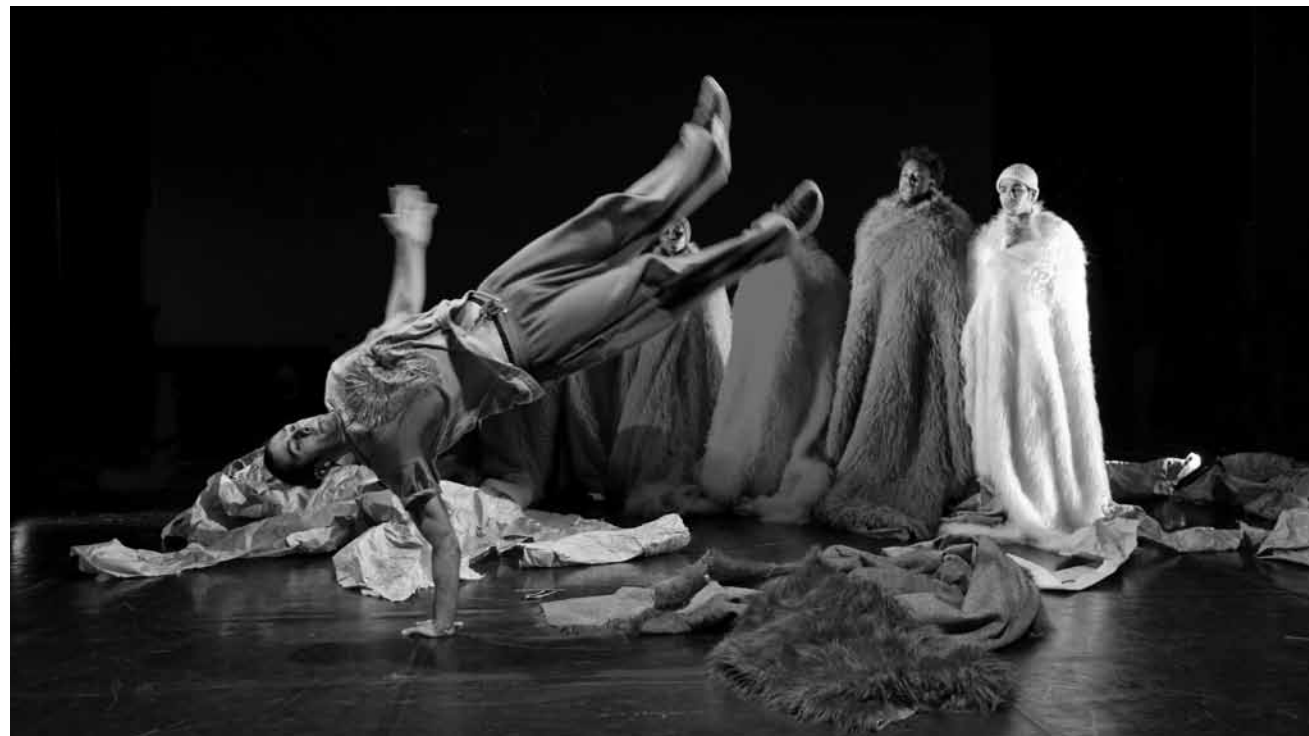
Robyn Orlin et Angelin Preljocaj sont de retour avec deux créations réalisées dans le cadre du festival « Cités dans le variations 2012 », les 17 et 18 février au Grand Théâtre.

Josef und Maria, Monolog nach dem Roman von Nick Hornby, Modehaus Marx, Trier (D), 20h. Tel. 0049 651 7 18 18 18.