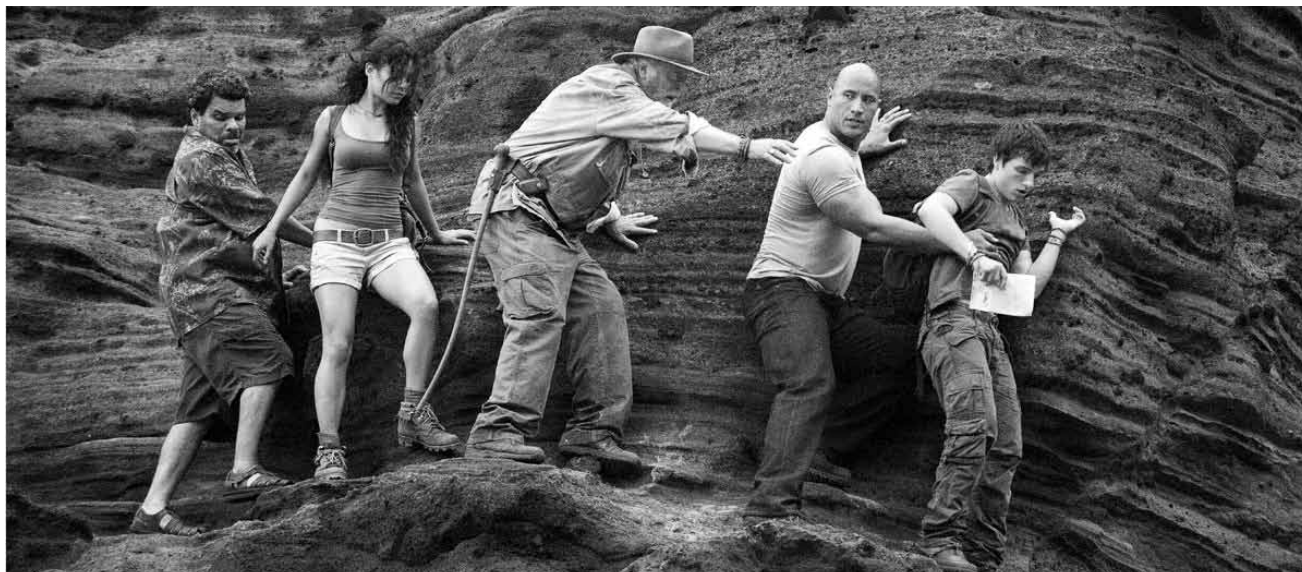
Der Mittelpunkt der Erde war wohl nicht genug Abenteuerstoff. Nun geht's zur Abwechslung auf eine einsame, geheimnisvolle Insel: „Journey 2: The Mysterious Island“, neu im Utopolis und CinéBelval.

Au même moment, Arletty tombe gravement malade. ❖❖❖ Une fable sur l'humanité, sur son absurdité mais aussi son altruisme sur fond du drame subi par les réfugiés clandestins. (dv)