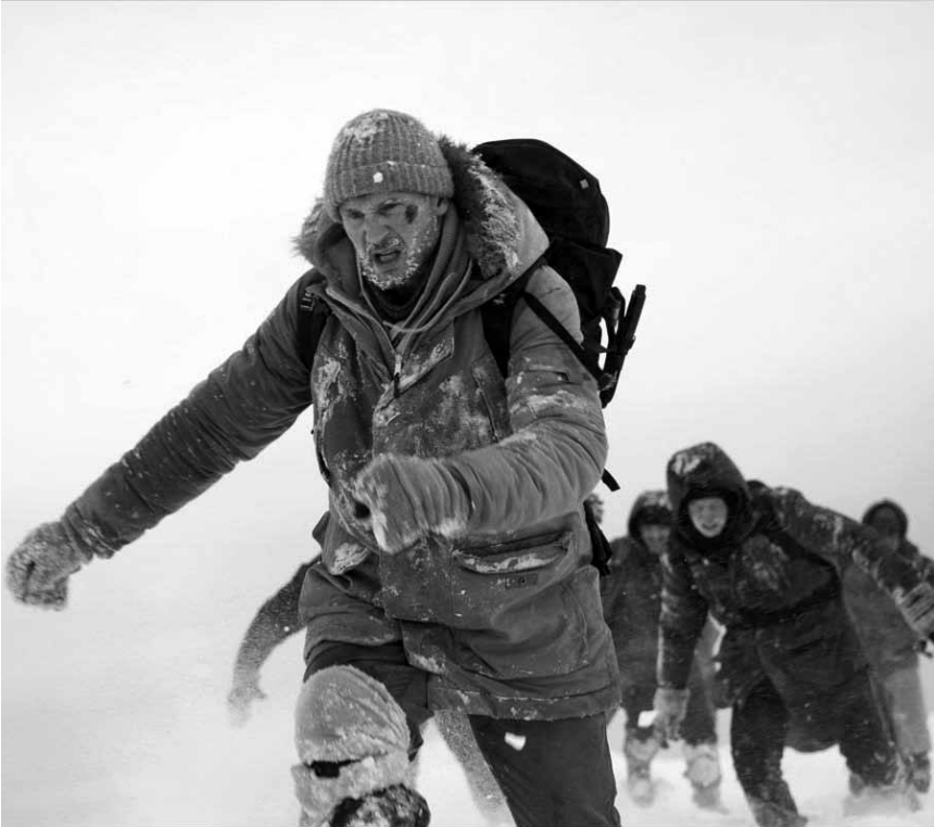
Im Kampf mit Flora und Fauna: In „The Grey“ müssen die Überlebenden eines Flugzeugabsturzes den Weg nach Süden finden. Neu im Utopolis und CinéBelval.

Dino est un chat qui partage sa vie entre deux maisons. Le jour, il vit avec