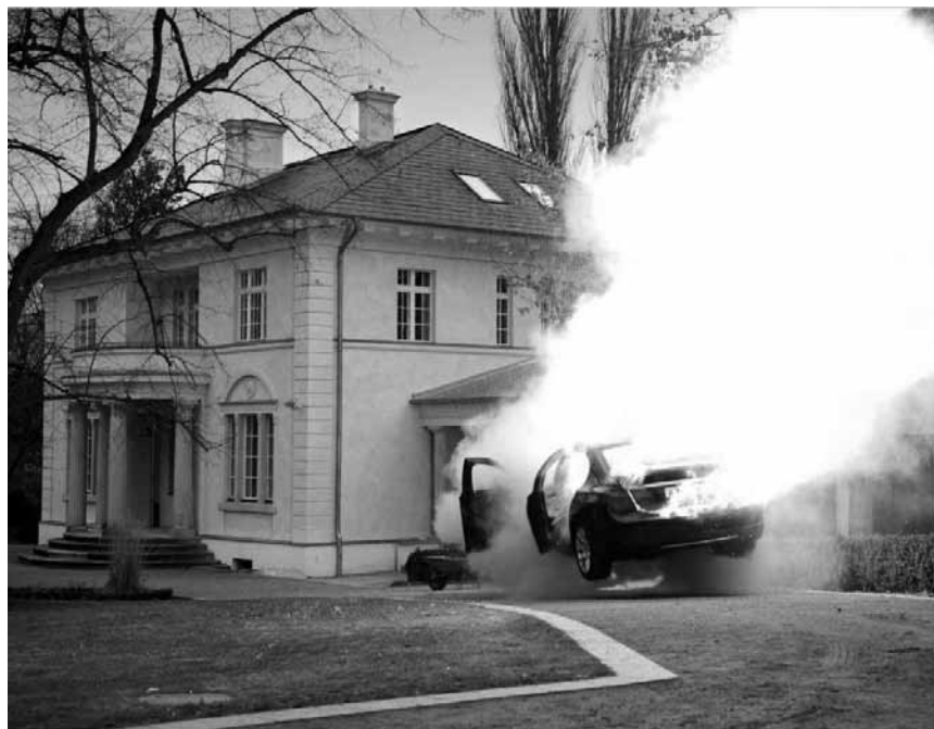
Journalismus in Russland ist immer noch ein explosives Metier: „Die vierte Macht“, am Donnerstag im Kursaal. Im Rahmen von „100 Joer Kursaal“.