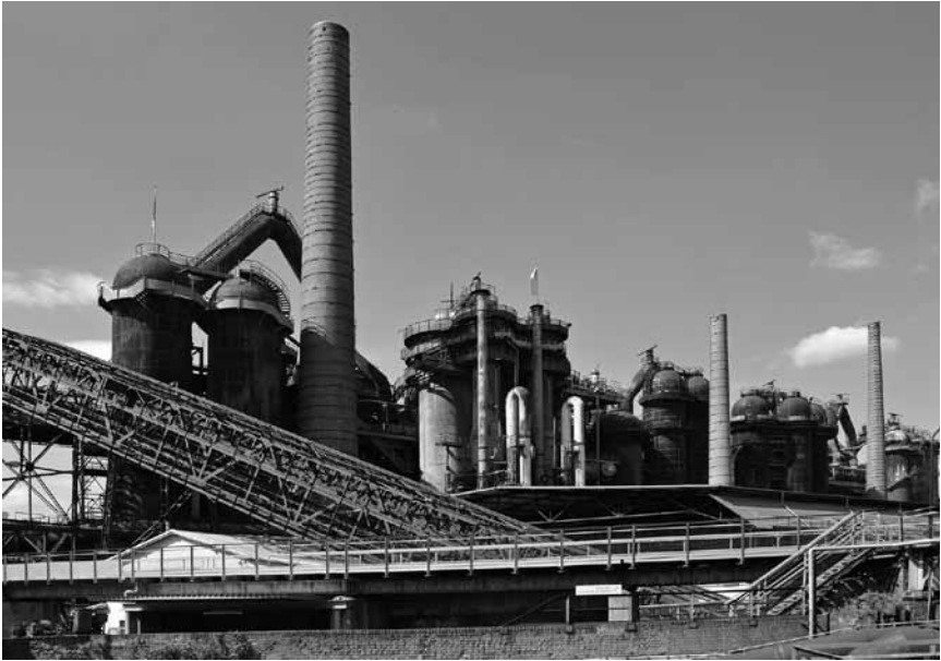
„Die Straße des Feuers“ - Die Geschichte der Völklinger Hütte und anderen Industrieanlagen in SaarLorLux, kann man anhand der Aufnahmen von Josef Scherer bis zum 28. März im Wiltzer Schloss nachvollziehen.

peintures, Art Contemporain Nosbaum & Reding (4, rue Wiltheim, tél. 26 19 05 55), jusqu'au 3.3, ve. + sa. 11h - 18h.