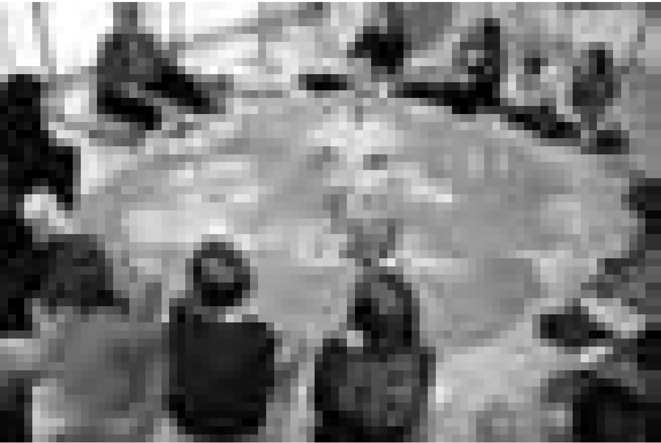
Die interaktive Ausstellung „Klima, Kanu, Quetschekraut“, gastiert noch bis zum 24. August im Trierer Palais Walderdorff.

chefs d'oeuvres exceptionnels, Centre Pompidou (1, parvis des Droits de l'Homme, tél. 0033 3 87 15 39 39), jusqu'au 24.9, lu., me. + di. 11h - 18h, je. + ve. 11h - 20h, sa. 10h - 20h, di. 10h - 18h.