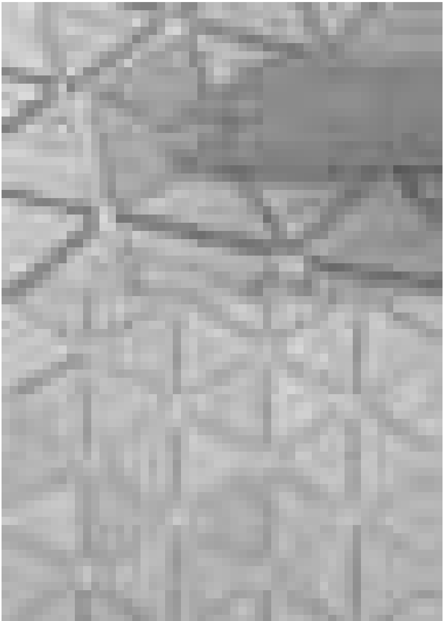
Kunst mit Fußgefühl: „Les M“ präsentieren ihr Sensorium noch bis zum 27. August im Mudam.