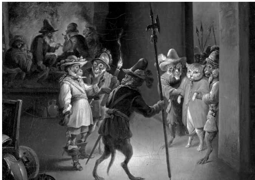
Dans le cadre de la visite-atelier « Chat c'est nous », les plus petits peuvent découvrir l'histoire et l'art, à la Villa Vauban, les 15 et 16 septembre.

Journée portes ouvertes, Arsenal, Metz (F), 13h - 22h. Tél. 0033 3 87 74 16 16.