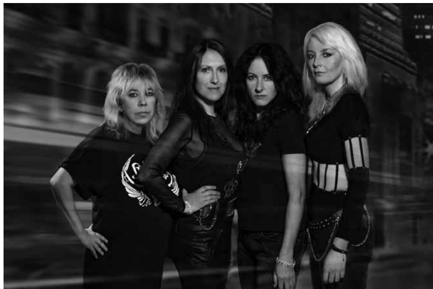
D'Éisleker Metal Frënn rocken lo schonn zanter zéng Joer, an dat gëtt den 22. September zu Folschette mat ënner anerem der britescher Band Girlschool gefeiert.

Pilzbestimmungsabend , Haus vun der Natur, Kockelscheuer , 18h - 19h30. Tel. 29 04 04-1.