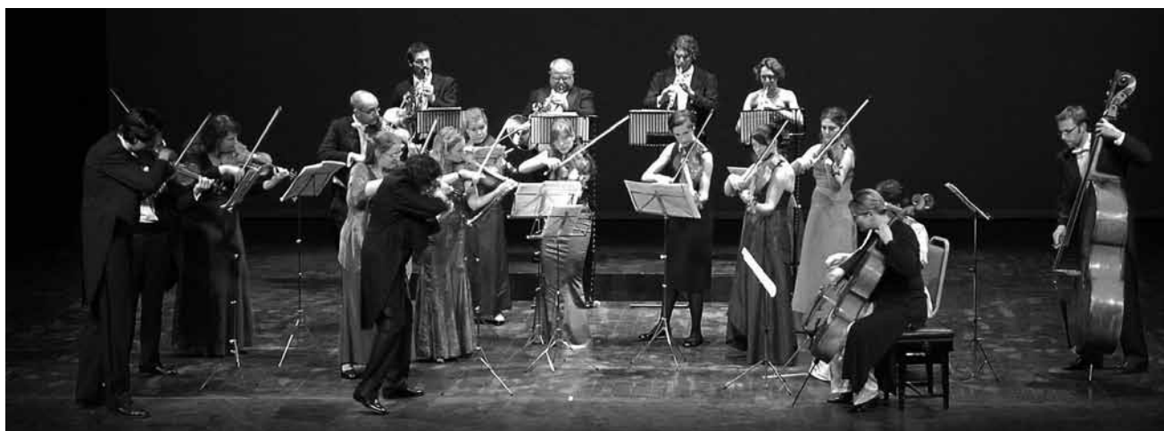
Das European Chamber Orchestra ist am 29. September im Cape Ettelbrück zu Gast.

Melting Session 4 & Cell (O) Division, Centre culturel régional opderschmelz, Dudelange , 20h. Tél. 51 61 21-290.