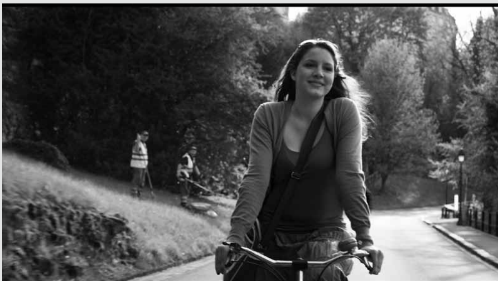
FLOU - FANNY KINSCH - (C) SAMSA FILM-ESPERA PRODUCTIONS-2012

Tarif : 5 € / séance. Abo 4 séances : 16 € / 8 € www.ape.lu