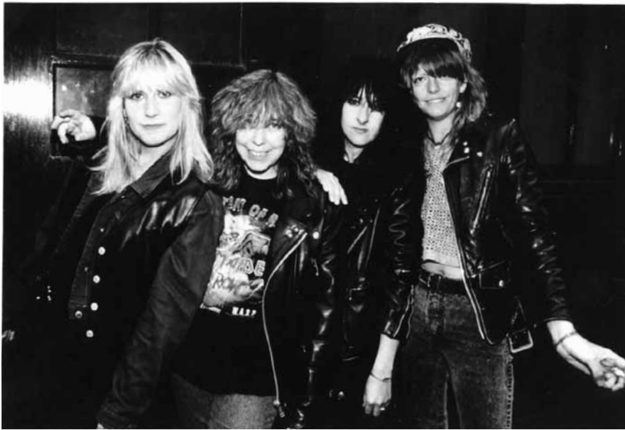
30 ans et presque pas une ride : Girlschool.