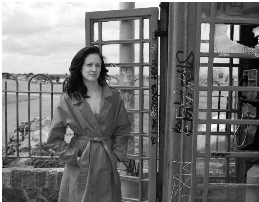
Der blutige Nordirland-Konflikt steht im Zentrum von „Shadow Dancer“, im Rahmen der British and Irish Film Season am Sonntag im Utopia.

✖✖ Der Film rechnet zwar mit den traditionellen Disney Geschlechterkonventionen ab, doch leider ist die Handlung dafür sehr flach und fantasielos. (Claire Bartelemy)