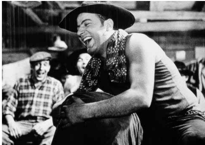
„Spur der Steine“ - ein DDR-Filmklassiker über eine ungleiche Liebe in der klassenlosen Gesellschaft. Am Mittwoch in der Cinémathèque, in Anwesenheit des Hauptdarstellers Manfred Krug.

En mai 1962, Chris Marker et son équipe, caméra à l'épaule, filment Paris et ses habitants. Le film est divisé en deux parties. « La prière sur la Tour Eiffel » donne la parole aux gens de tous les jours qui créent l'atmosphère de ce mois de mai. « Le retour de Fantômas » nous plonge davantage dans la réalité politique et sociale par des interviews de personnes ayant choisi un engagement.