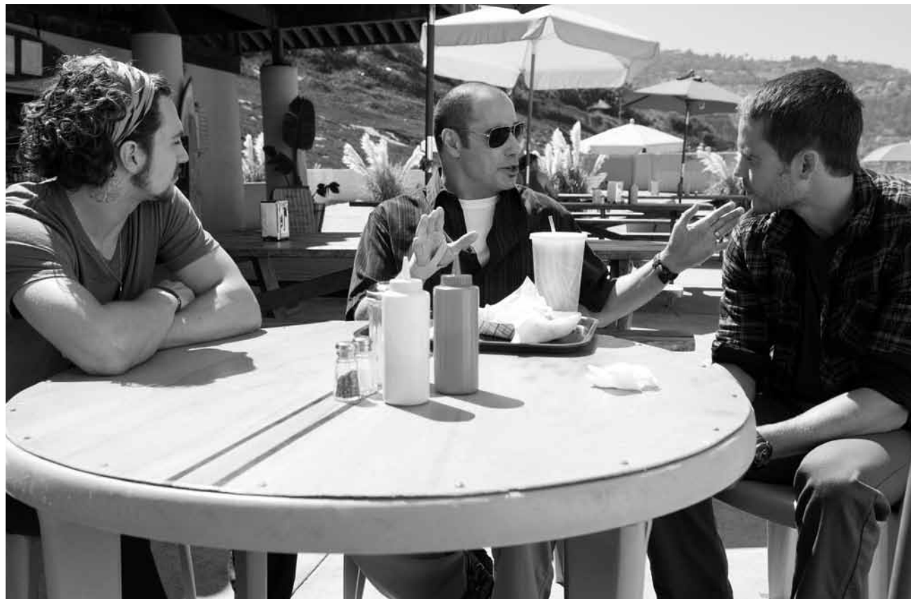
Auch wenn man sehr vorsichtig ist, gilt: Mit Drogen macht man sich nicht nur Freunde. „Savages“, neu im CinéBelval und im Utopolis.

✂ Il semble un peu que le manque de perspectives qui assaille les deux jeunes protagonistes précaires ait aussi atteint le scénario. (lc)