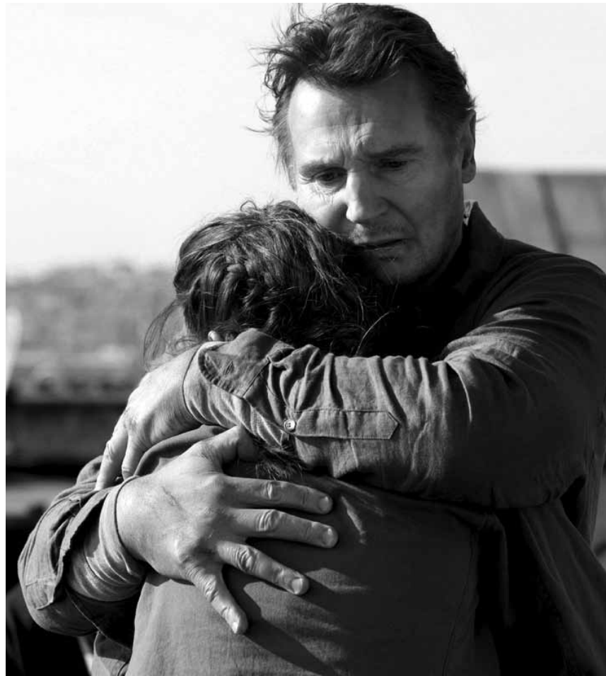
Liam Neeson muss böse Mafiagangster verhaften, in „Taken 2“, neu im CinéBelval und im Utopolis.

Nachdem der frühere CIA-Topagent Mills seine Tochter Kim aus den Klauen eines Mädchenhändlerrings befreit hat, lebt er zurückgezogen als Leibwächter eines Scheichs in Istanbul. Doch dieses Mal muss Kim ihn retten, da er und sein Kumpel Leonard von einem rachsüchtigen Kidnapper als Geiseln genommen werden.