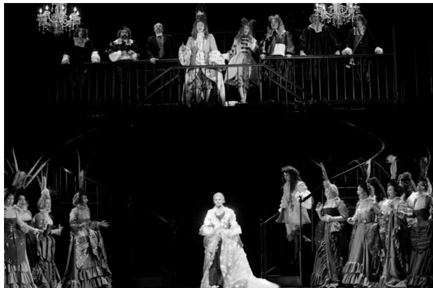
Cendrillon de Jules Massenet est un opéra féerique que le public pourra découvrir ces 6, 8 et 10 octobre au Grand Théâtre de Luxembourg.