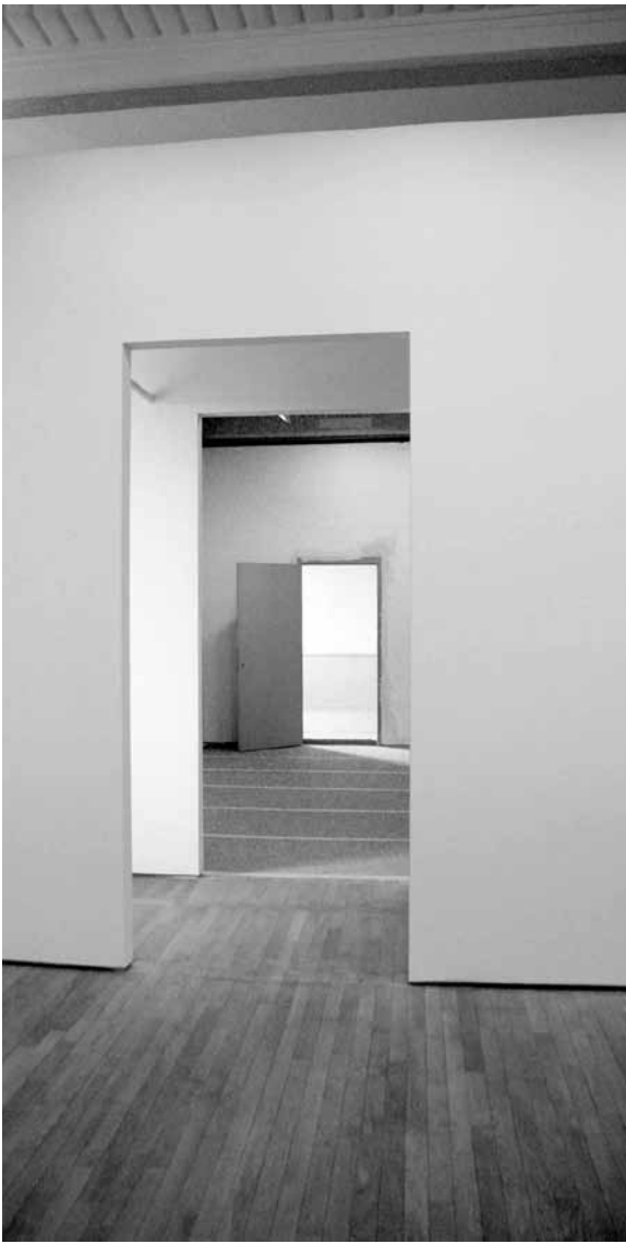
White Cubes au Casino Luxembourg