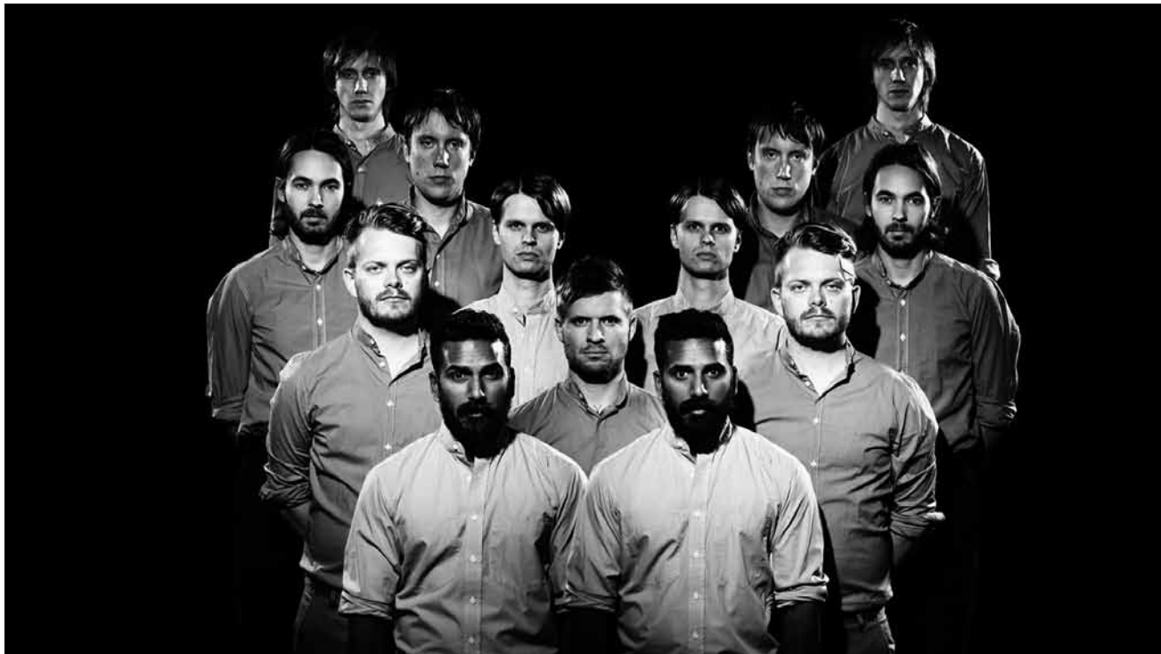
Kennen den Mann im Mond wohl persönlich: „Cult of Luna“.