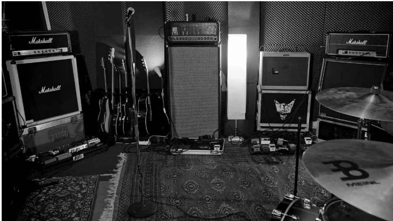
Une salle de répétition vide, c'est tout ce qui restera d'Eternal Tango... à part de bons souvenirs.