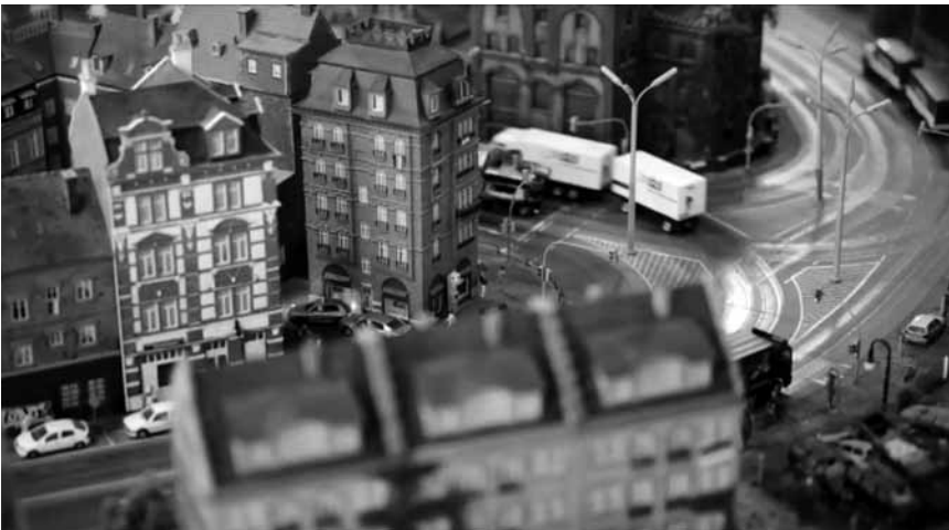
Daniel Seideneders Film „Hurdy Gurdy“ wurde 2012 im Rahmen des „Brooklyn Film Festival“ vorgestellt und läuft nun bis zum 31. Januar in den Konschtkëschen landesweit.

„Alles in allem (...) eine gut gemachte, pädagogisch durchaus wertvolle Ausstellung, die manche kritischen Ansätze birgt, sich aber leider nur zu selten traut an der Oberfläche zu kratzen.“ (Christian Steinbach)