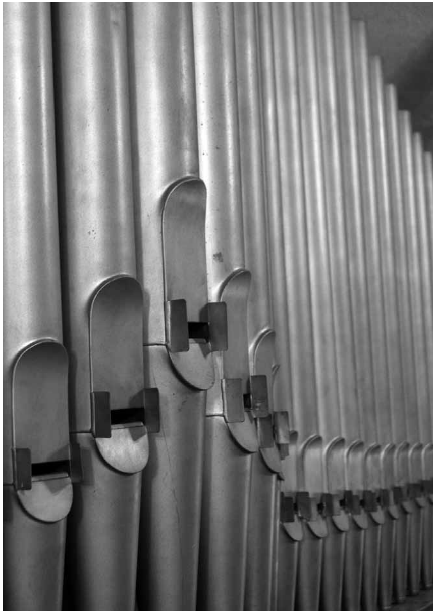
Wie bringt man Metall zum Klingen? Die Antwort findet man in der Ausstellung „Vom Stück Holz zum Klangkörper“, die am 31. Januar im Mierscher Kulturhaus ihre Türen öffnet.

Tchick Tchack (1, rue d'Ell, info@tchicktchack.lu), jusqu'au 30.3, ma. - sa. 12h - 14h, ve. + sa. également en soirée.