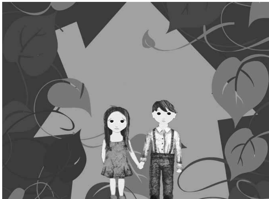
Die Kinderoper „Hänsel und Gretel“ von Engelbert Humperdinck - der Komponist, nicht der Schmalzsänger - kommt am 23. und am 24. März in die Abtei Neumünster.

Les Gavroches , Brasserie L'Inouï, Redange/Attert, 20h. Tél. 26 62 02 31.