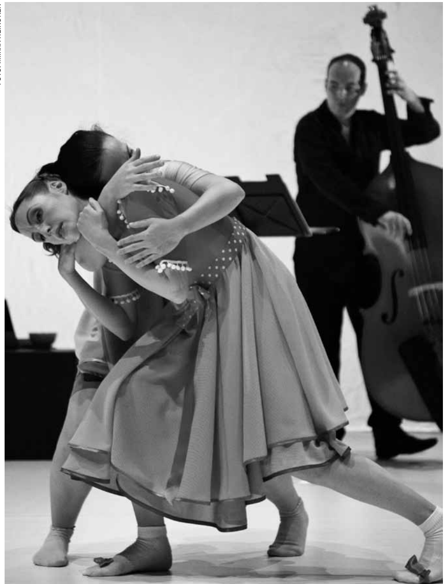
Das Tanzspektakel „Duu Duo“ - von der Choreografin Anu Sistonen ins Leben gerufen - beschäftigt sich mit dem Thema Freundschaft im Kindesalter - am 27. März in der Maison de la Culture in Arlon.

Ligne de la beauté, ligne de la liberté , rencontre avec Didier Semin, Auditorium Wendel du Centre Pompidou, Metz (F), 19h30. Tél. 0033 3 87 15 39 39.