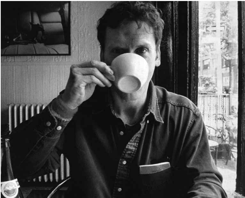
Zorniges „Enfant terrible“ der Theaterszene: Will Eno.