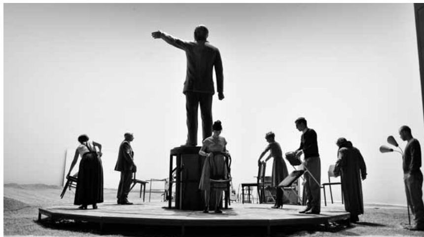
Maxim Gorkis „Kleinbürger“ zählt zu den ersten Erfolgen des russischen Schriftstellers. Gastspiel des Deutschen Theaters Berlin, am 2. und 3. März im Grand Théâtre.

Tanzreigen , Choreographie von George Balanchine, mit dem Bayerischen