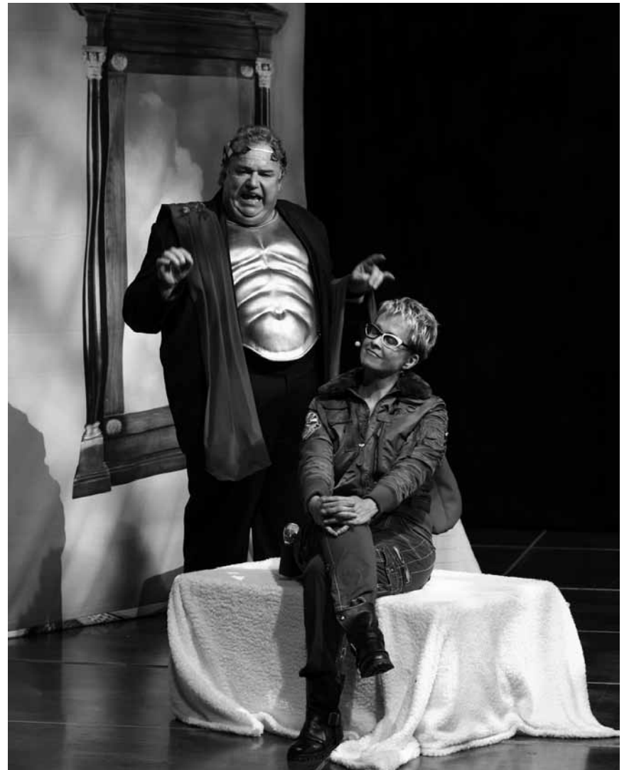
„Orpheus an der Ennerwelt“ - dem Jacques Offenbach säi Meeschterwierk kann een lo och op Lëtzebuergesch genéissen, zum Beispill dëse Freiden 8. März am Mamer Kinneksbond.